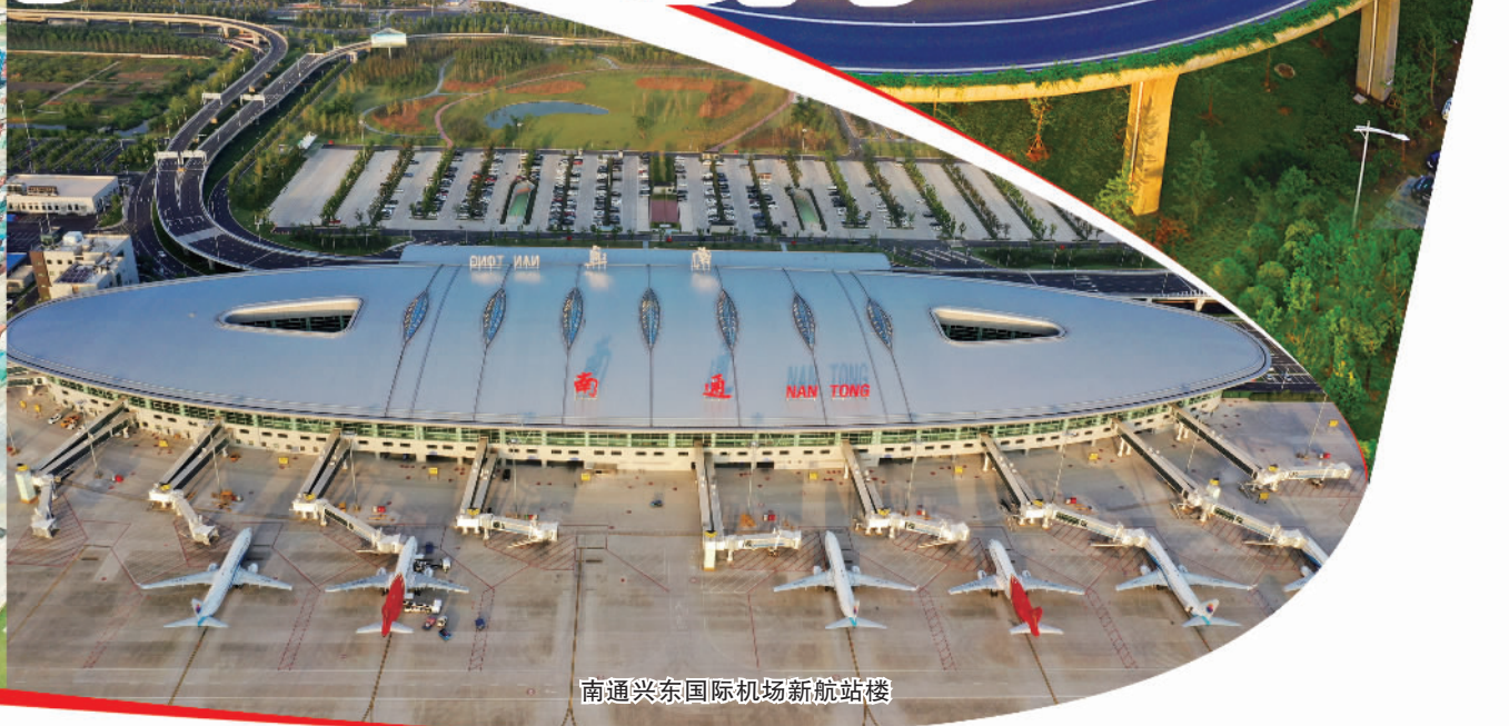
南通兴东国际机场新航站楼

近年来,江苏省南通市国资委积极探索融合党建新路径,致力于建设服务型、创新型党组织,打造“国企之家”党建服务品牌,推动企业党建工作创品牌创特色,持续提升党建工作质量,将党的政治优势、组织优势转化为国企发展的竞争优势、发展优势。