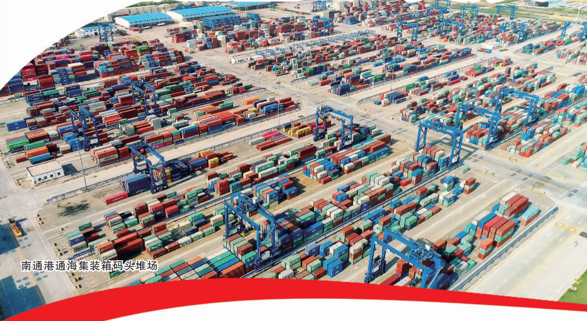
南通港通海集装箱码头堆场