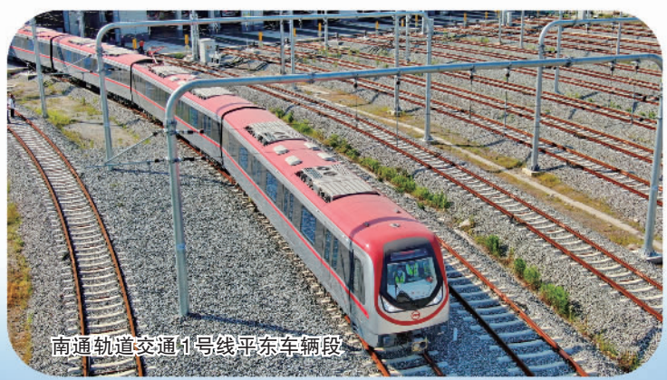
南通轨道交通1号线平东车辆段