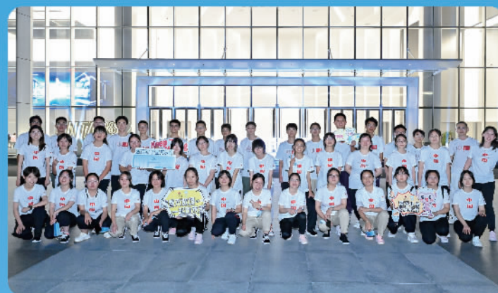
在福建省晋江市举办的“爱不止步 点亮未来”安踏希望班福建研学营，孩子们参观安踏982中心

资助品学兼优、家庭困难的高中生完成学业，联合中国青少年发展基金会引入科技、国学等优质教育课程，培养学生树立健康阳光的人生观，在超越自我中追逐梦想。