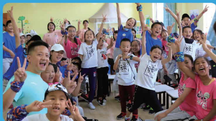
在云南省大理白族自治州弥渡县寅街镇大庄完全小学安踏梦想中心，孩子们正在体验梦想课

通过建设标准化素质发展空间，提供教师培训和梦想课程，提升学生综合素养，帮助青少年更好成长。