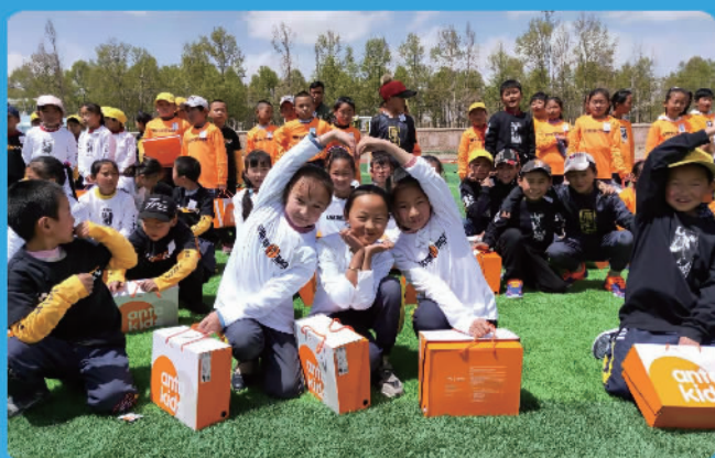
江西省希望小学学生收到安踏装备包

向欠发达地区中小学校捐赠运动鞋、运动服和运动配件，让学生们穿上安踏专业运动装备，享受运动的纯粹和美妙。