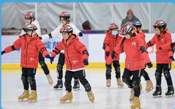
在北京举办的“冬奥有我”安踏茁壮成长公益计划运动营中，孩子们正在体验滑冰运动

为家庭困难、热爱运动的欠发达地区青少年提供机会，在体验运动项目的过程中，培养运动兴趣，激发运动潜能，感受奥林匹克精神。