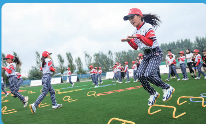
在北京棒球天使棒球基地，来自四川省凉山彝族自治州美姑县的孩子们正在体验安踏体育课

通过线上线下组合方式培训一线体育教师，提升专业体育教育水平，从而提升学生的运动能力，助力欠发达地区体育教育发展。