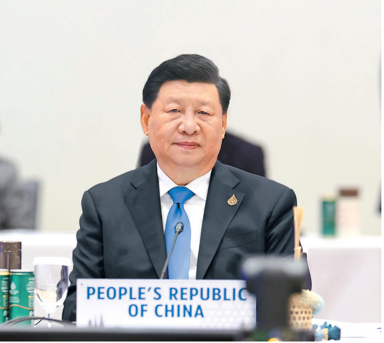
当地时间11月19日上午,国家主席习近平在泰国曼谷继续出席亚太经合组织第二十九次领导人非正式会议。