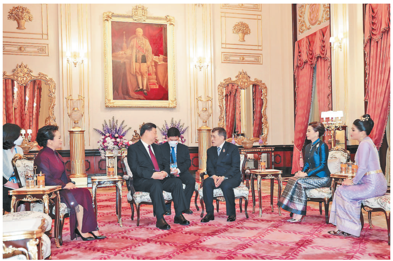
当地时间11月18日晚,国家主席习近平和夫人彭丽媛在曼谷大王宫会见泰国国王哇集拉隆功和王后素提达。