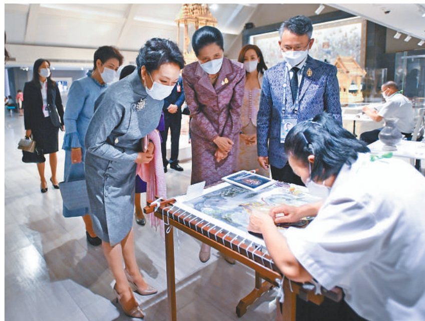
当地时间18日上午,应泰国总理夫人娜拉蓬邀请,国家主席习近平夫人彭丽媛同参加亚太经合组织第二十九次领导人非正式会议的部分经济体领导人及代表配偶共同参观大城府国家艺术博物馆。这是彭丽媛在娜拉蓬的陪同下参观泰国传统手工艺展示。