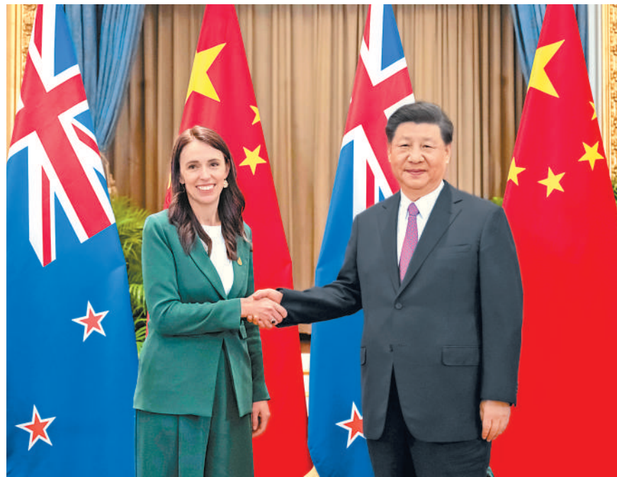
当地时间11月18日下午,国家主席习近平在泰国曼谷会见新西兰总理阿德恩。