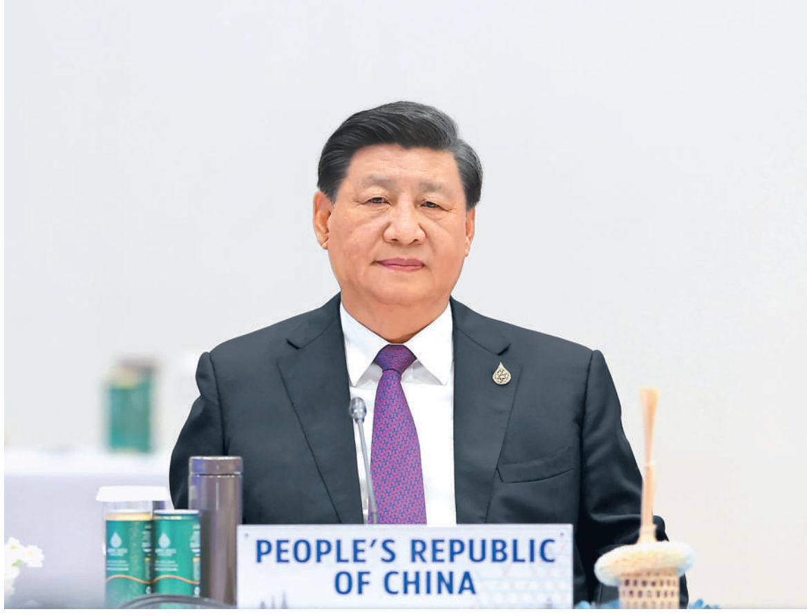
当地时间11月18日上午,亚太经合组织第二十九次领导人非正式会议在泰国曼谷国家会议中心举行。国家主席习近平出席会议并发表题为《团结合作勇担责任 构建亚太命运共同体》的重要讲话。

■ 上个月,中国共产党第二十次全国代表大会成功举行,为当前和今后一个时期中国发展指明了方向、规划了蓝图。中国愿同所有国家在相互尊重、平等互利的基础上和平共处、共同发展。中国将坚持实施更大范围、更宽领域、更深层次对外开放,坚持走中国式现代化道路,建设更高水平开放型经济新体制,继续同世界特别是亚太分享中国发展的机遇