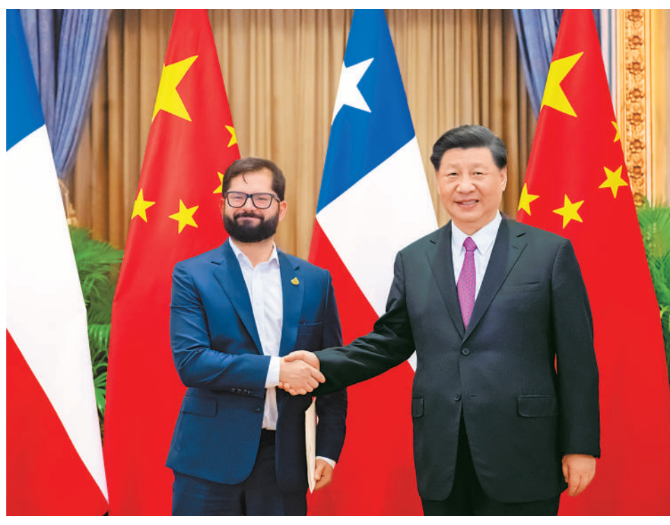
当地时间11月18日下午,国家主席习近平在泰国曼谷会见智利总统博里奇。

本报曼谷11月18日电 (记者任彦、刘歌)当地时间11月18日下午,国家主席习近平在曼谷会见智利总统博里奇。 习近平指出,智利是首个同中国建交的南美国家。半个多世纪以来,中智关系作为中国同拉美和加勒比国家关系先行者,成为发展中国家合作共赢的典范,值