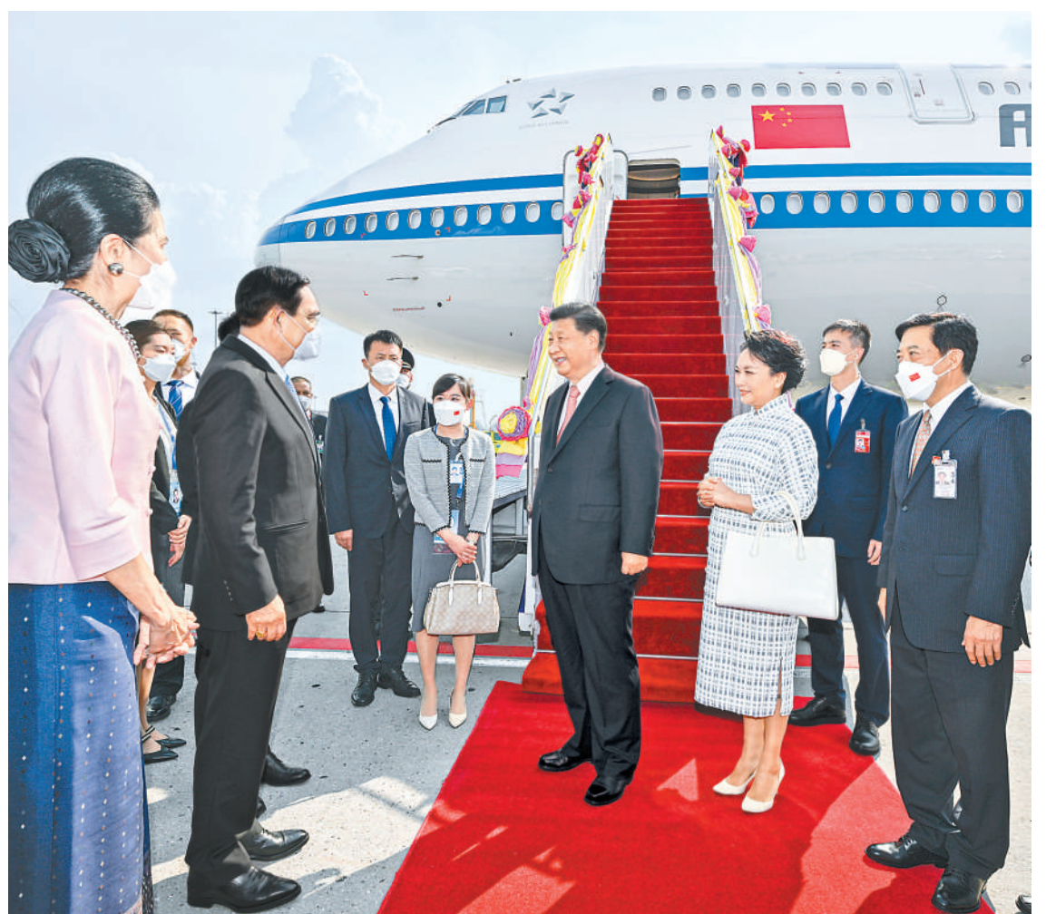
当地时间十一月十七日下午，国家主席习近平乘专机抵达泰国曼谷，出席亚太经合组织第二十九次领导人非正式会议并对泰国进行访问。这是习近平和夫人彭丽媛乘坐的专机抵达曼谷素万那普国际机场时，泰国总理巴育夫妇、副总理兼外长敦夫夫妇、文化部部长伊提蓬夫妇等热情迎接。

当地时间十一月十七日下午，国家主席习近平乘专机抵达泰国曼谷，出席亚太经合组织第二十九次领导人非正式会议并对泰国进行访问。 习近平和夫人彭丽媛乘坐的专机抵达曼谷素万那普国际机场时，泰国总理巴育夫妇、副总理兼外长敦夫夫妇、文化部部长伊提蓬夫妇等热情迎接。礼兵分列红地毯两侧，身着靓丽民族服装的当地青年行合十礼夹道欢迎，泰国华侨华人代表挥舞中泰两国国旗，向习近平夫妇表示最热烈的欢迎。 习近平乘坐的车队离开机场前往下榻饭店途中，巨幅电子屏上一片“中国红”，用中泰两国文字写着“热烈欢迎中华人民共和国主席习近平阁下和夫人彭丽媛教授”“中泰一家亲”，到处洋溢着热烈友好的情谊。华侨华人和中国留学生簇拥在街道两旁，举着“热烈欢迎习近平主席！”“泰国侨胞热烈欢迎习近平主席！”的红色横幅，欢呼“习主席好！”“欢迎习主席！”，表达对习近平到访的热烈欢迎和由衷喜悦。