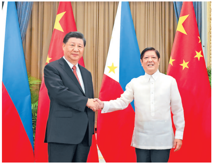
当地时间11月17日下午，国家主席习近平在泰国曼谷会见菲律宾总统马科斯。

本报曼谷11月17日电（记者陈一鸣）当地时间11月17日下午，国家主席习近平在泰国曼谷会见菲律宾总统马科斯。 习近平指出，中方始终从战略高度看待中菲关系。今年5月我们通电话时，就新时期中菲关系发展达成一系列重要共识，双方确立了农业、基建、能源、人文四大重点合作领域。双方要努力打造合作亮点，提升合作质量，造福两国人民。中方愿同菲方传承友谊，接续合作，共同致力于国家发展振兴，谱写中菲友好新篇章。 习近平强调，中方愿同菲方保持经常性沟通，继续照顾对方关切。双方要持续深化“一带一路”倡议同菲律宾“多建好建”规划对接，建设好达沃—萨马尔大桥项目，探讨开展“两国双园”合作，加强清洁能源、教育、公共卫生合作。中方愿扩大进口更多菲律宾优质农副产品。双方要多出实招密切人文交流，夯实中菲友谊民意基础。在南海问题上，双方要坚持友好协商，妥善处理分歧。中菲同为亚洲发展中国家，要坚持战略自主。 （下转第二版）