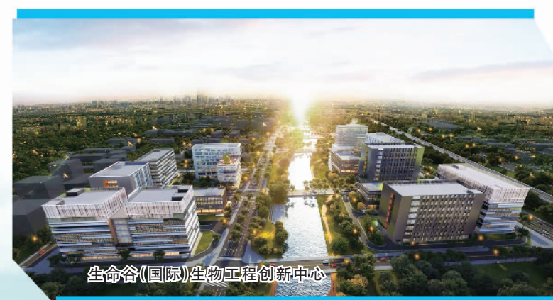
生命谷(国际)生物工程创新中心