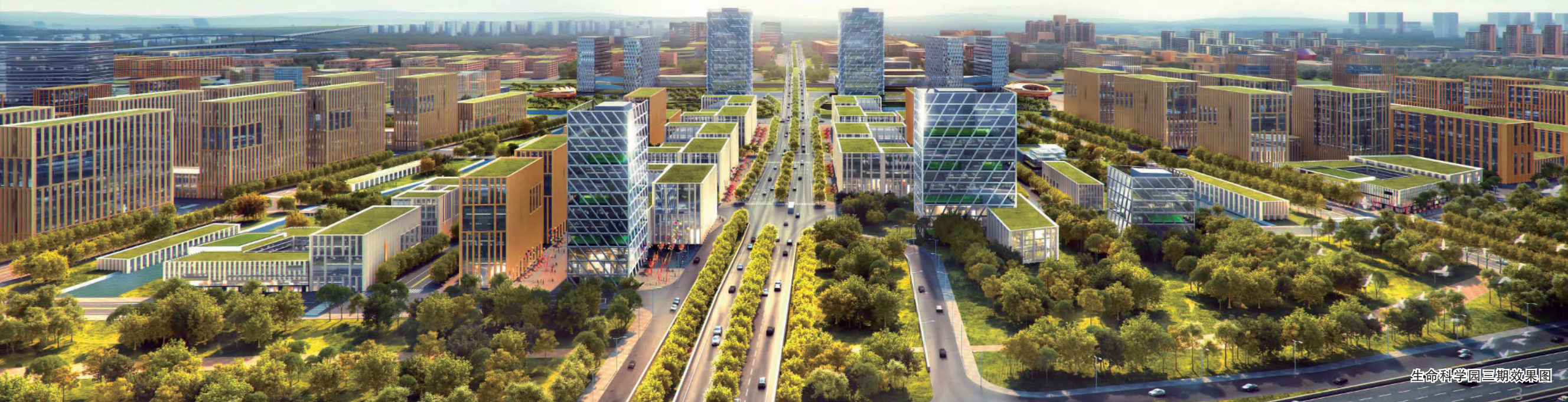
生命科学园三期效果图