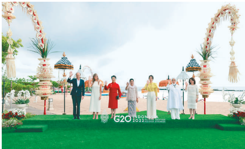
当地时间11月15日上午，国家主席习近平夫人彭丽媛在巴厘岛出席印度尼西亚总统夫人伊莉亚娜组织的二十国集团领导人第十七次峰会领导人配偶活动。这是彭丽媛同其他领导人配偶以海天为背景集体合影。