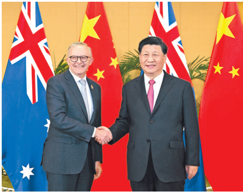
当地时间11月15日下午，国家主席习近平在印度尼西亚巴厘岛会见澳大利亚总理阿尔巴尼斯。