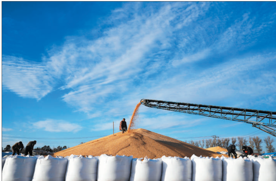
上图：北大荒集团北安分公司的工作人员在一处晒场的玉米堆上忙碌。

“最美退役军人”是广大退役军人退役不褪色、永远跟党走的生动写照。学习和推崇退役军人身上的宝贵品质，同他们一道担当作为、奋斗奉献，在新的赶考路上勇毅前行，我们定能书写无愧于时代、无愧于人民的优异答卷！