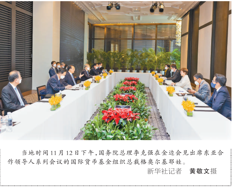
当地时间11月12日下午,国务院总理李克强在金边会见出席东亚合作领导人系列会议的国际货币基金组织总裁格奥尔基耶娃。