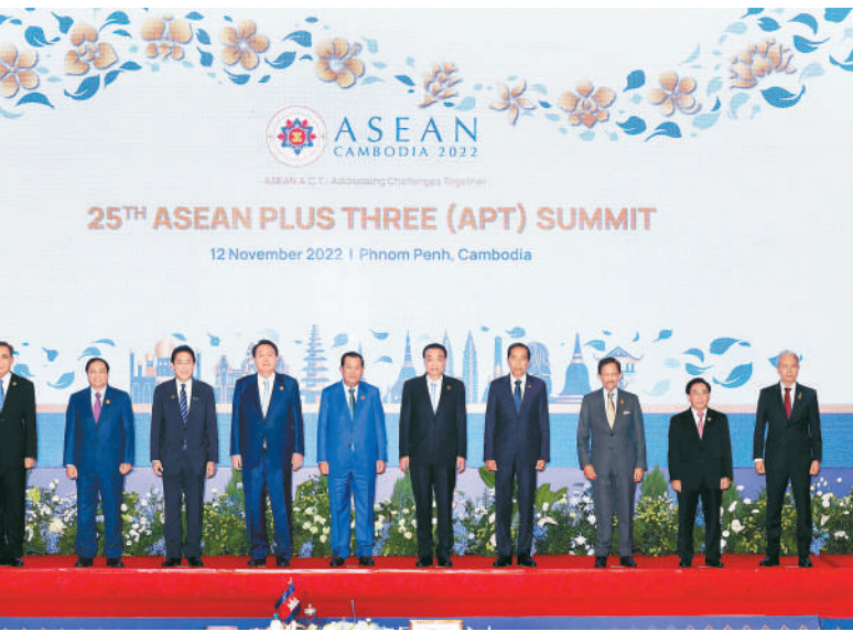
当地时间11月12日上午,国务院总理李克强在柬埔寨金边出席第25次东盟与中日韩(10+3)领导人会议。这是与会领导人集体合影。