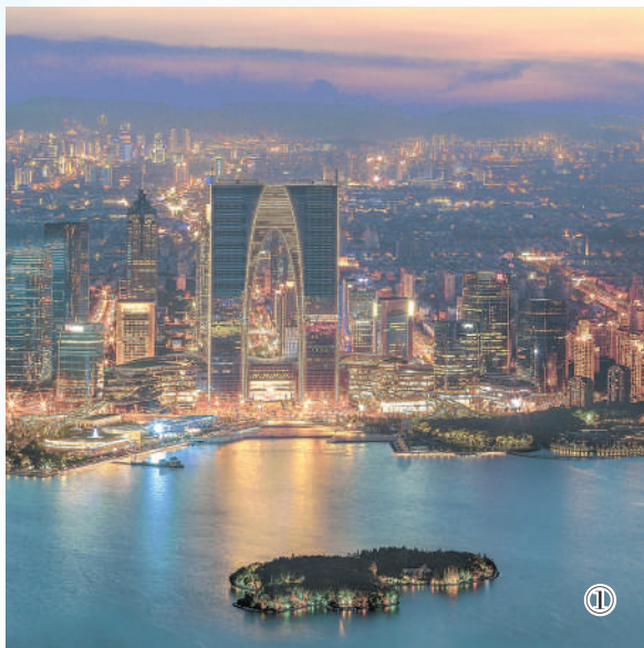
图①:江苏苏州金鸡湖畔景观。

安徽省委常委、合肥市委书记虞爱华说,6年时间里,G60科创走廊各地走进了国家发展战略,走上了进博会的大舞台,也走出一条科创大道。