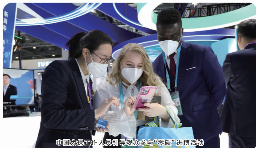
中国太保工作人员引导观众参与“零碳”进博活动