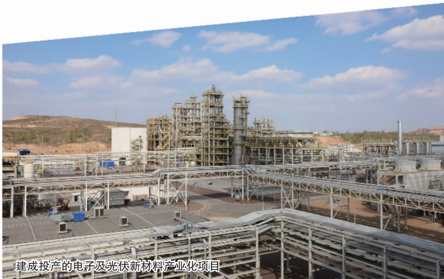
建成投产的电子及光伏新材料产业化项目

绿水青山就是金山银山。陕西有色金属集团把绿色发展理念全方位贯穿于生产经营全过程，持续加大资金投入，发展循环经济，推动绿色发