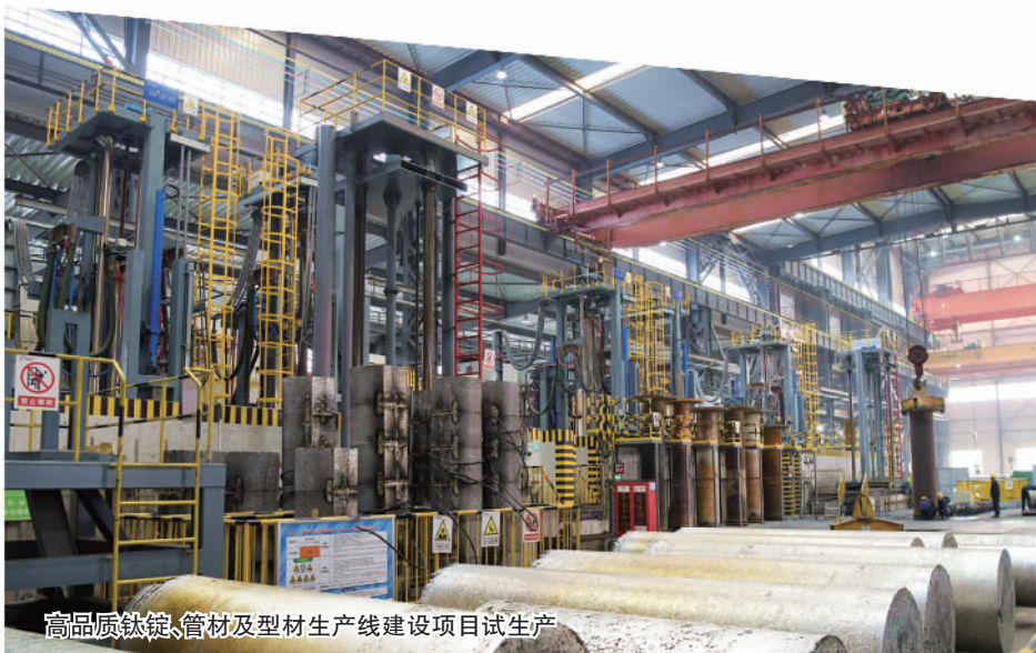
高品质钛锭、管材及型材生产线建设项目试生产