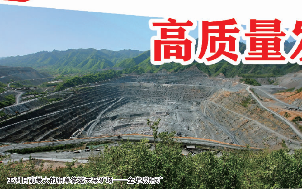
亚洲目前最大的铜单体系露天采场——金堆城铜矿