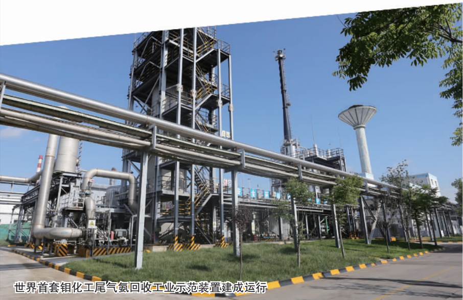
世界首套钼化工尾气氮回收工业示范装置建成运行