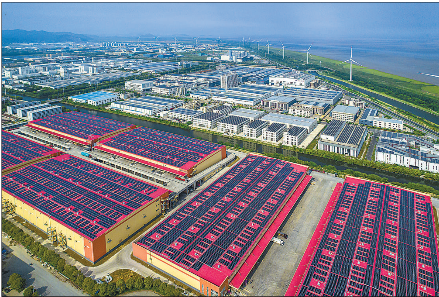
近年来，浙江嘉兴海宁市大力发展分布式光伏等新能源，利用厂房、学校、办公楼、居民屋顶等安装光伏发电装置，年发绿电近7亿千瓦时，实现新能源100%就地高效消纳。图为近日拍摄的尖山绿色低碳工业园示范区企业屋顶。

指导意见站在推进文娱领域综合治理的高度，充分整合现有法律法规和政策性文件，综合运用市场竞争、行业管理、监管执法、行业自律、社会监督等多种措施，构建起规范明星广告代言活动的治理体系，为维护好明星代言领域清朗空间提供新的制度支撑。