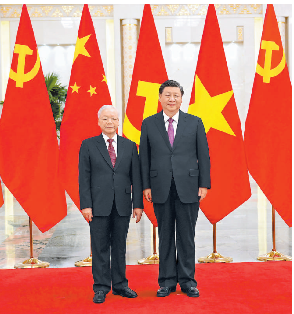
10月31日,中共中央总书记、国家主席习近平在北京人民大会堂同越共中央总书记阮富仲举行会谈。这是会谈前,习近平在人民大会堂北大厅为阮富仲举行欢迎仪式。