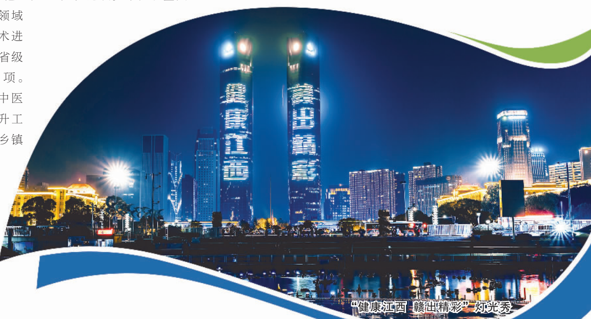
“健康江西 赣出精彩”灯光秀