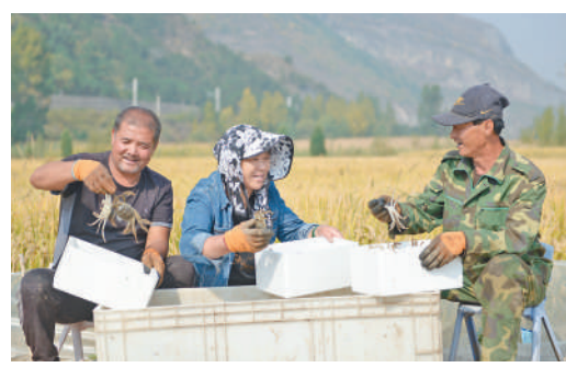
▲滦平县金沟屯镇丰泰种植农民专业合作社，村民们正在将螃蟹装箱。