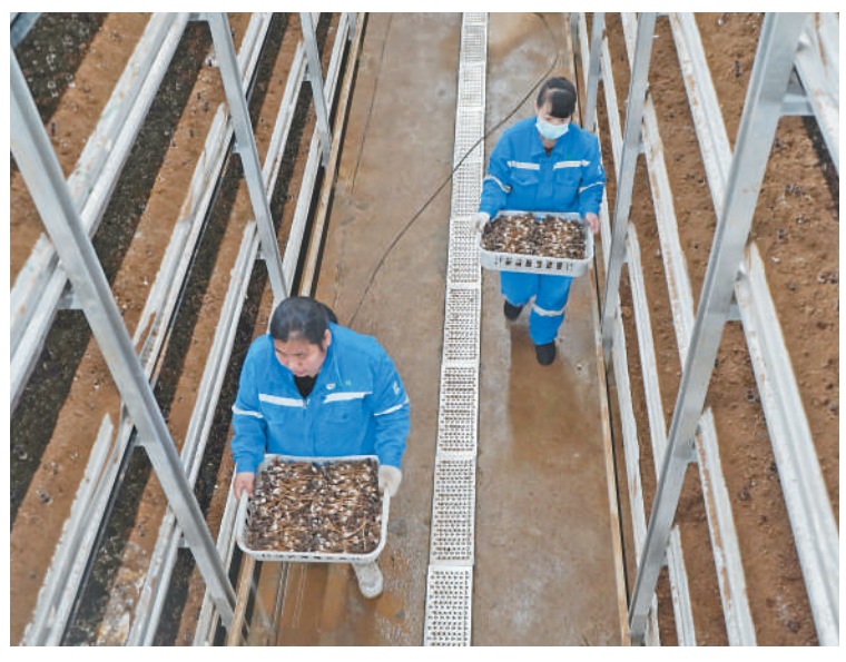
▲滦平县安纯沟门镇承德润邦5G智慧农业园，村民们正在采摘黑皮鸡枞菌。