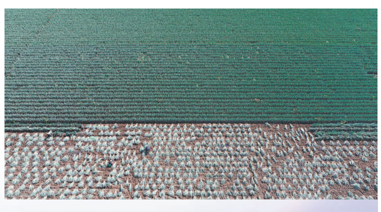
▲滦平县红旗镇红旗村蔬菜种植基地，菜农正在收获大蒜。