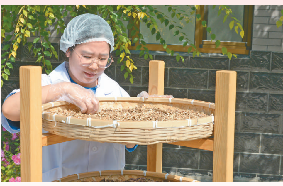
▲滦平县金沟屯镇下管子村热河中药花海小镇，工作人员正在晾晒中药材。