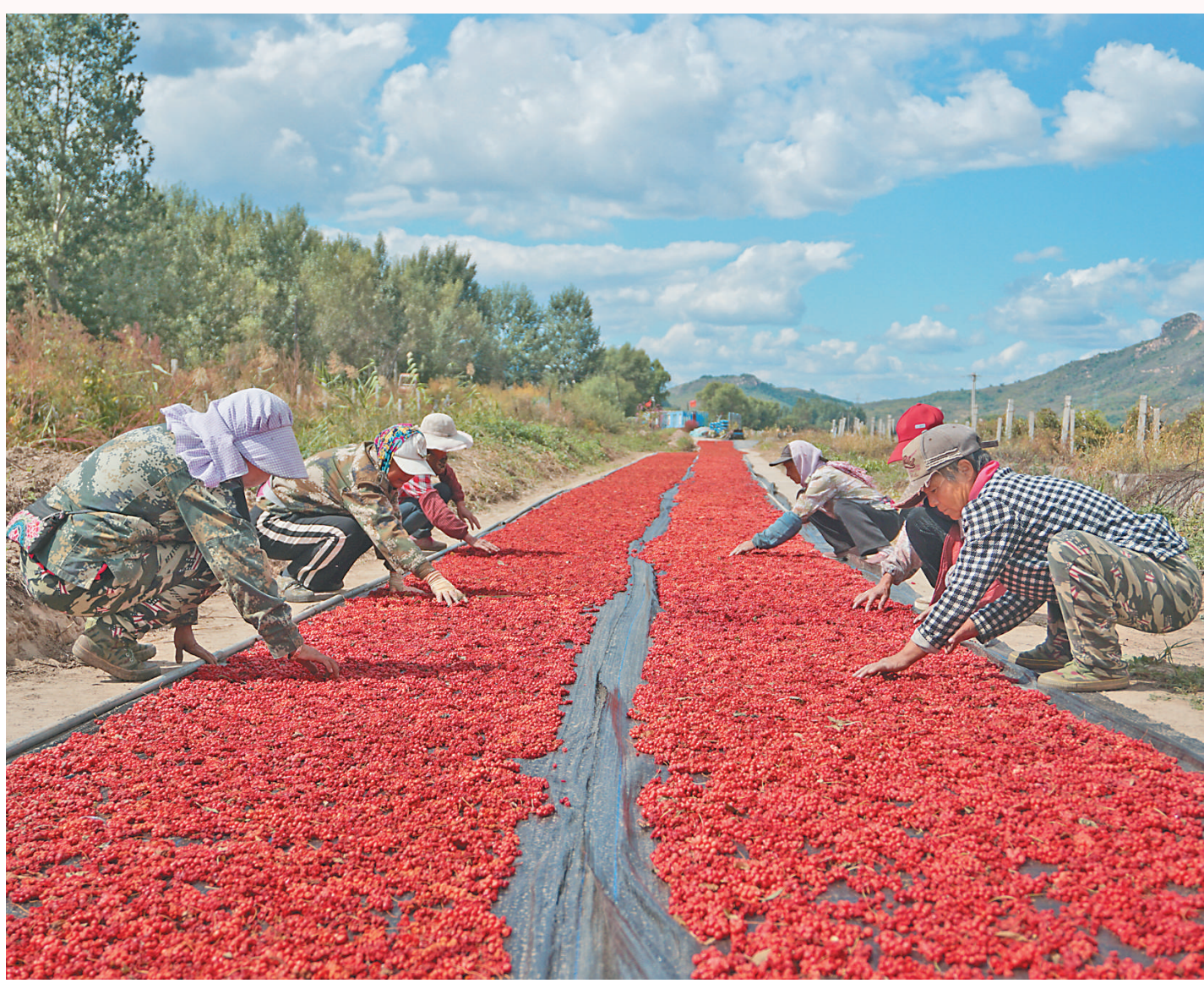
▲滦平县张百湾镇西井沟村祥森农牧专业合作社，村民们抢抓农时，对中药材五味子进行晾晒。