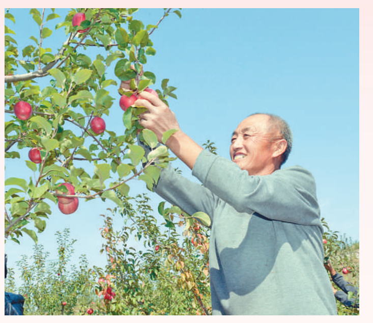
▲滦平县滦平镇狼山顶种植园里，果农正在采摘苹果。