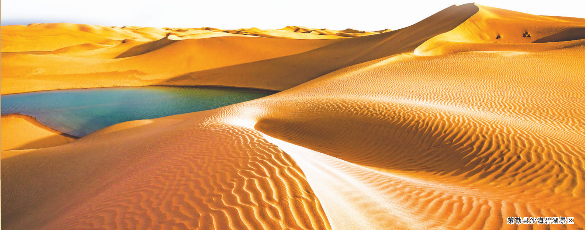
策勒县沙海碧湖景区