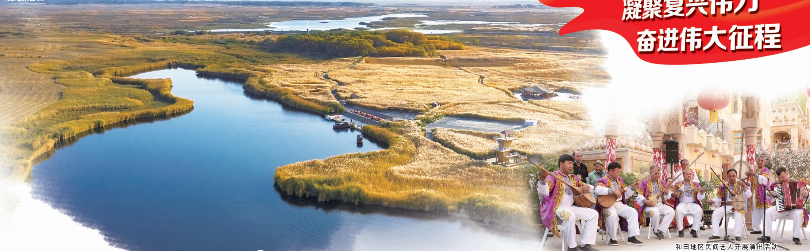
和田地区民间艺人开展演出活动