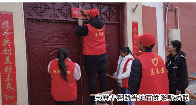
志愿者帮助当地百姓张贴对联

建文旅产业园,树援疆新地标。近期,坐落于新疆和田地区于田县托格日孜村的库尔班·吐鲁木文旅产业园经过精心打造后正式启用,22家非遗文创及“和田优品”专营店、12家知名文旅企业及美食城、精品民宿等同步开业,停车场、游客中心等配套设施一应俱全,民族团结广场典雅大气,特色街区独具韵味……这是天津援疆以推进文化润疆和乡村振兴示范村建设为目的,以创新推进和田地区第三产业融合发展和促进百姓就业为目标,依托库尔班·吐鲁木纪念馆红色旅游名片、当地丰厚的文化旅游资源和优越的地理位置,投资数千万元打造的集游、购、娱、吃、住、行于一体的文旅产业项目。游客在民族风情建筑内可沉浸式体验和和田地区艾德莱斯绸、桑皮纸、铜铁器、传统乐器等代表性非遗文创产品的制作过程,实现“一村饱览和田文化、一村嗨购和田特产、一村遍尝和田美食”。此外,文化、影视、传媒、旅游、研学等优质文旅企业的落户,将更加立体全面地促进和田地区文旅产业项目的高质量发展。剪纸、泥人张、皮画等来自天津的非遗项目为园区增添亮丽色彩。