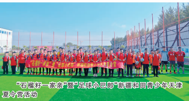
“石榴籽一家亲”暨“足球小巴郎”新疆和田青少年天津夏令营活动