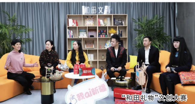
“和田礼物”文创大赛