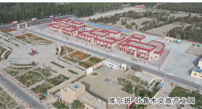
库尔班·吐鲁木文旅产业园