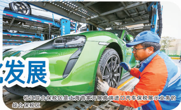
松江综合保税区是上海首家开展高端进口汽车保税展示业务的综合保税区