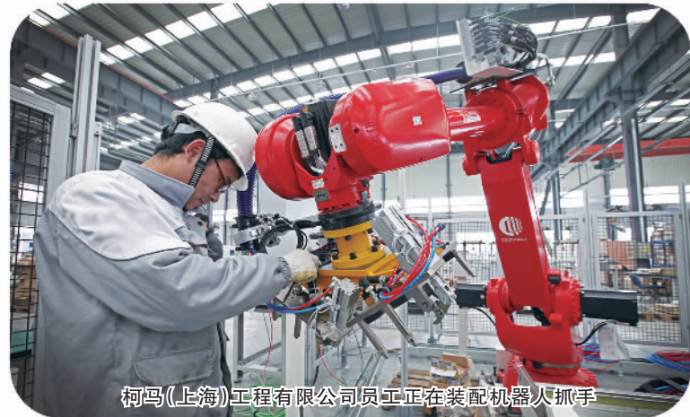
柯玛(上海)工程有限公司员工正在装配机器人抓手