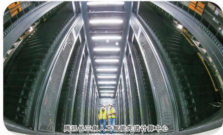
腾讯长三角人工智能先进计算中心