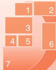
图①:金秋十月,广西壮族自治区柳州市柳城县古砦仫佬族乡,金黄的稻田与群山、道路、村落构成一幅田园画卷。