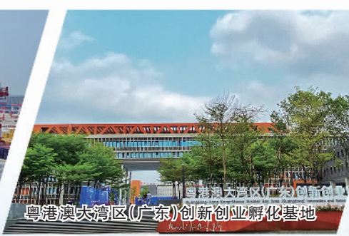
粤港澳大湾区(广东)创新创业孵化基地