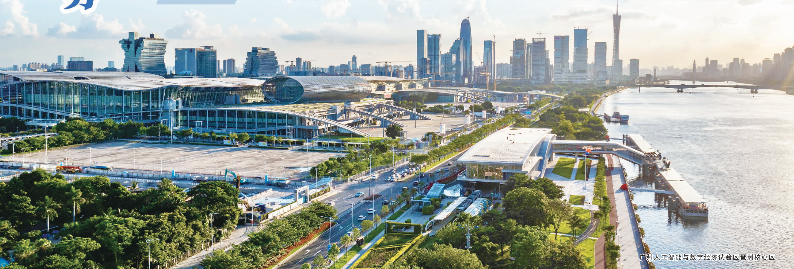
广州人工智能与数字经济试验区琶洲核心区