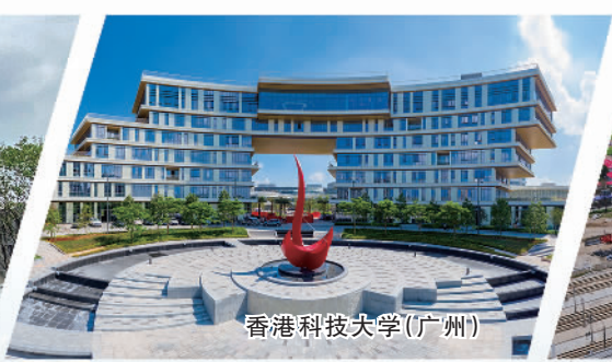
香港科技大学(广州)