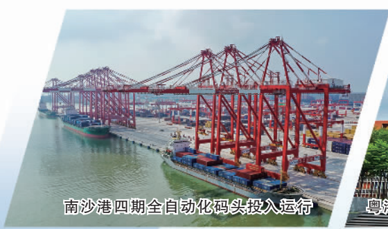
南沙港四期全自动化码头投入运行