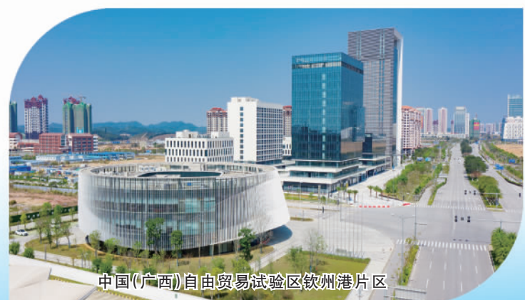
中国(广西)自由贸易试验区钦州港片区