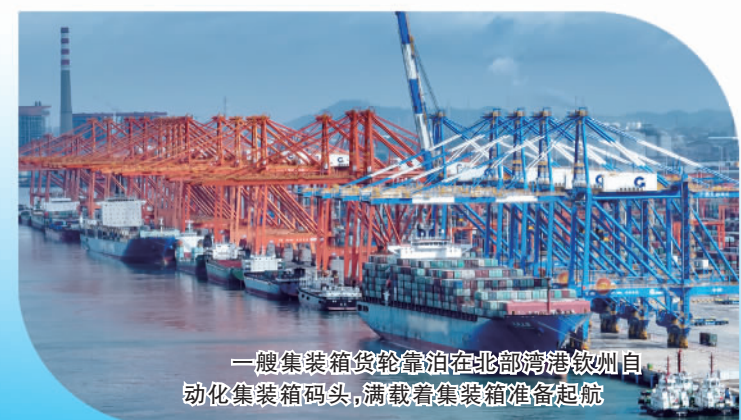
一艘集装箱货轮靠泊在北部湾港口钦州自动化集装箱码头，满载着集装箱准备启航

围绕做大做强做优向海经济目标，钦州市制定出台一批有针对性的产业政策、优惠政策，建立招商跟踪服务协调机制，吸引更多涉海企业落户。降低