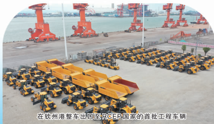
在钦州港整车运回至RCEP国家的首批工程车辆