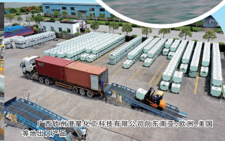
广西钦州澄星化工科技有限公司向东南亚、欧洲、美国等地出口产品