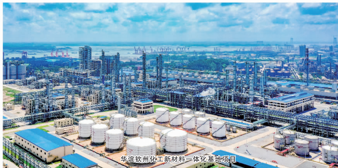
华道钦州化工新材料一体化基地项目