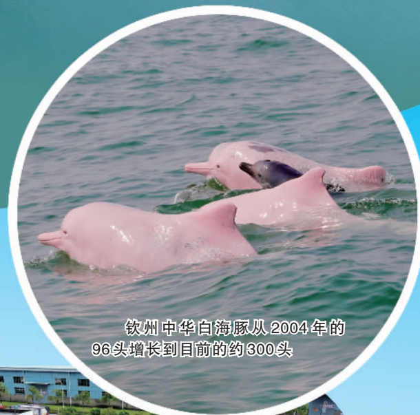
钦州中华白海豚从2004年的96头增长到目前的约300头

钦州，广西北部湾经济区核心位置上的一颗璀璨明珠，一头连西南、一头连东盟，是西部陆海新通道三条主通道的交汇点，向海优势突出，向海潜力巨大。