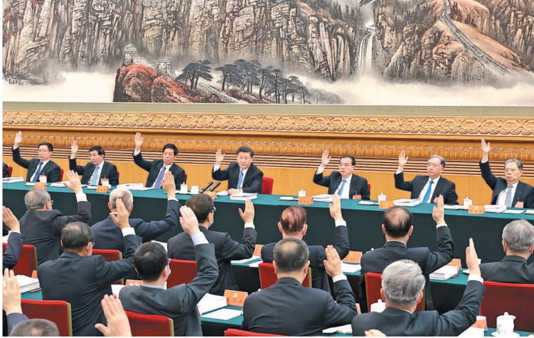
10月21日，中国共产党第二十次全国代表大会主席团在北京人民大会堂举行第三次会议。习近平、李克强、栗战书、汪洋、王沪宁、赵乐际、韩正等出席会议。