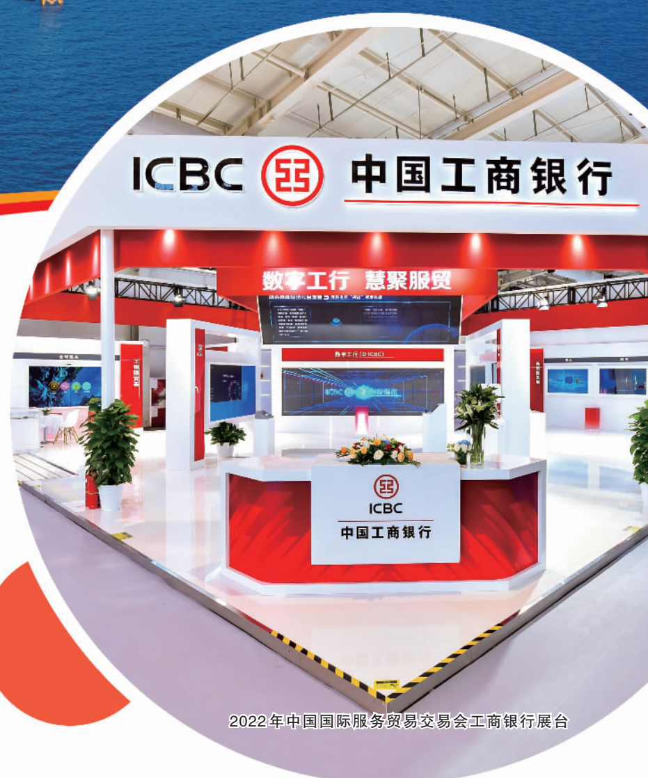
2022年中国国际服务贸易交易会工商银行展台

党的十八大以来,中国工商银行股份有限公司(简称“工商银行”)认真落实党中央、国务院决策部署,完整、准确、全面贯彻新发展理念,把创新、协调、绿色、开放、共享的新发展理念落实到金融服务与经营发展各领域全过程,不断提升金融服务的适应性、竞争力、普惠性,全力为服务构建新发展格局、推动高质量发展贡献金融力量。