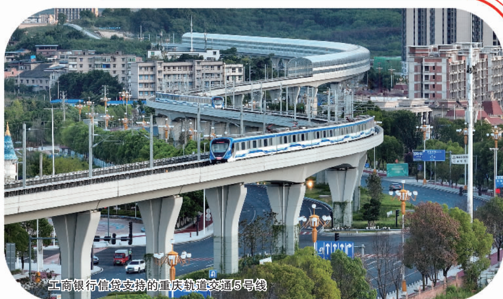
工商银行信贷支持的重庆轨道交通5号线