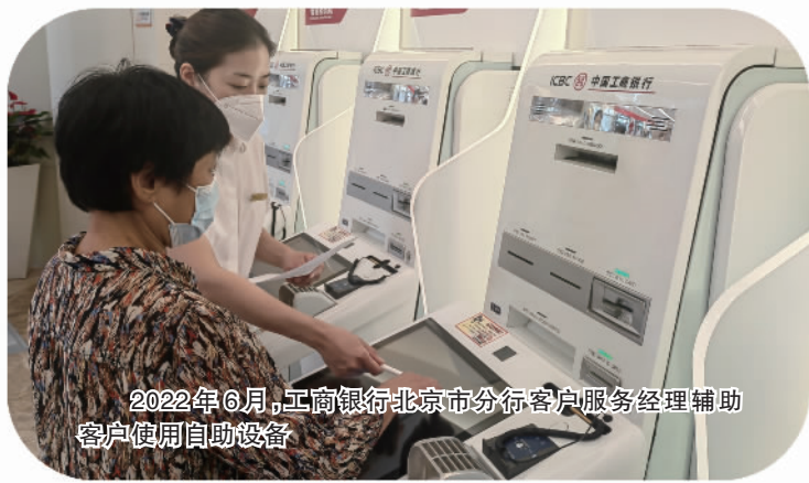
2022年6月,工商银行北京市分行客户服务经理辅助客户使用自助设备