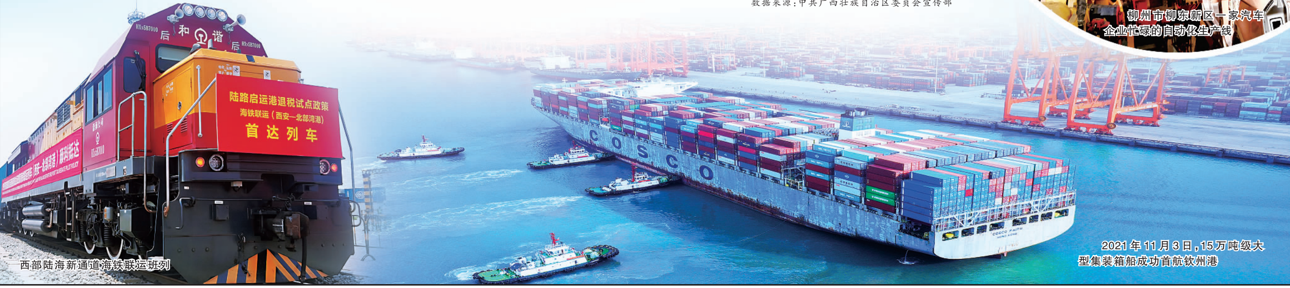
西部陆海新通道海铁联运班列