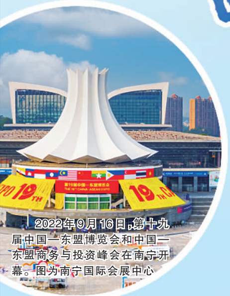
2022年9月16日，第十九届中国—东盟博览会和中国—东盟商务与投资峰会在南宁开幕。图为南宁国际会展中心

党的十八大以来，广西壮族自治区党委、政府认真贯彻落实党中央各项决策部署，团结带领全区各族人民凝心聚力建设新时代中国特色社会主义壮美广西，办好一系列喜事盛事，干成一系列大事要事，解决一系列难事急事，全面打赢脱贫攻坚战，全面建成小康社会，扎实做好“六稳”“六保”工作，交出了亮眼答卷，谱写了浓墨重彩的壮丽华章。