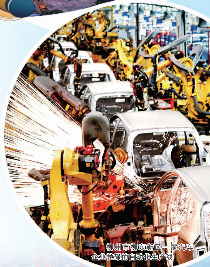
柳州市柳东新区一家汽车企业忙碌的自动化生产线

姓富、生态美的绿色发展画卷正徐徐展开。 着力在巩固发展民族团结、社会稳定、边疆安宁上彰显新担当。 扎实推进共同富裕，集中力量抓好普惠性、基础性、兜底性民生建设，就业、教育、医疗、社保等民生事业全面发展，学前教育毛入园率、九年义务教育巩固率、基本医保参保率稳步提高，社会保障基本实现应保尽保。扎实推进巩固拓展脱贫攻坚成果同乡村振兴有效衔接，加强对乡村振兴重点帮扶县的倾斜支持，2021年，城镇居民、农村居民人均可支配收入分别为2012年的1.9倍、2.4倍，各族人民生活加快改善，法治广西、平安广西建设扎实推进。深入开展民族团结进步宣传教育，加快建设铸牢中华民族共同体意识示范区。深入实施兴边富民行动，进一步提升边境地区公共服务、产业发展水平，坚决守好祖国“南大门”。丰富人民群众精神文化生活，公共文化服务网络覆盖城乡，“壮族三月三”等民族特色文化品牌影响力进一步提升，群众性精神文明创建活动扎实开展。今日广西，壮乡儿女正在用勤劳的双手创造更具品质更有品味的美好生活。 迈向现代化新征程，全区上下将努力建设更为繁荣富裕、团结和谐、开放包容、文明法治、宜居康寿的广西，奋力谱写全面建设社会主义现代化国家广西篇章。