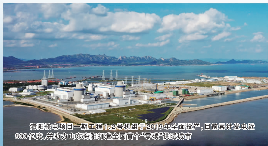
海阳核能项目一期工程1、2号机组于2019年全面投产,目前累计发电近800亿度,并助力山东海阳打造全国首个“零碳”供暖城市

到2035年,国家电投清洁能源装机占比力争突破85%,为我国实现“双碳”目标作出更大贡献。