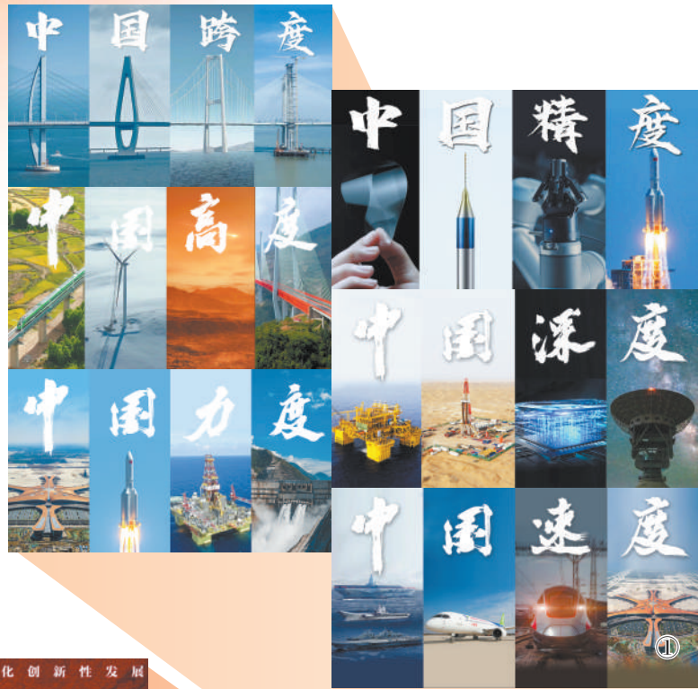
图①:人民日报新媒体9月12日起推出《我们这十年·坐标中国》系列短片,以党的十八大以来的十年时间为经,以不断刷新的中国跨度、中国精度、中国高度、中国深度、中国力度、中国速度等刻度为纬,集中展现十年来的重大工程和重大成就。目前已推出6集,全网阅读播放量超过3.5亿次。