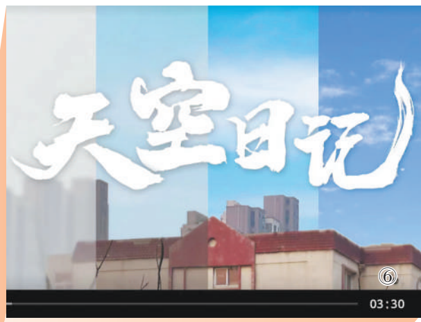
图⑥:今年6月以来,由人民日报社经济社会部、生态环境部宣教司、人民网联合开展的“晒晒我的‘家乡蓝’”摄影作品征集活动,真实记录了各地蓝天保卫战的巨大成就,生动反映了习近平生态文明思想的真理力量和实践伟力。

据统计,“晒晒我的‘家乡蓝’”摄影作品和故事,在人民日报、网、端、微各载体的总阅读量超过2亿次。一幅幅蓝天照片、一个个动人故事,深深打动了海内外读者。