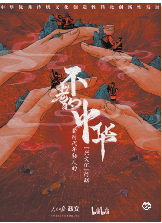
图②:新时代10年,对中华优秀传统文化的创造性转化、创新性发展蔚为壮观。人民日报社政治文化部推出5集系列短视频《不老的中华》,讲述12名知名度较高的年轻人10年来传承和弘扬中华优秀传统文化的故事,涉及民乐、戏曲、建筑、中草药、传统手工艺等领域,被全网热传。国庆节期间,该系列产品借助人民日报海外社交媒体等向海外传播,引发热烈讨论。