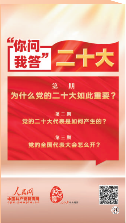
图⑨:为迎接党的二十大胜利召开,人民网·中国共产党新闻网联合“一本政经”工作室制作推出“‘你问我答’二十大”短视频栏目。栏目以“短视频+图解”的形式,介绍党的二十大的基本知识。第一期视频《为什么党的二十大如此重要?》在党的二十大新闻中心官网焦点图、人民网首页焦点图、人民网微博、人民日报评论微博、中国记协微信公众号、学习大国微信公众号等平台重点推送,全网阅读播放量超3000万次。