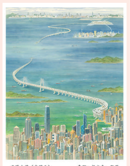
图⑧:10月1日,人民日报社文艺部基于当日见报的美术作品专版《绘写大江大河的万千气象》,以“诗配画”的海报形式,制作了新媒体产品《丹青中国·大江大河》。绝美的画面与意境深远的诗句辉映,引发读者“爱我中华”的情感共鸣。该产品在人民日报微博首发后,当日阅读量近600万人次。网友留言:“祖国江山美如画,妙笔生花更添彩”“妙笔丹青绘山河,祝福祖国繁荣昌盛”。