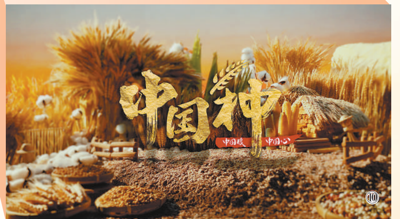
图⑩:粮食安全是“国之大者”,种子是农业的“芯片”。在第五个“中国农民丰收节”之际,人民日报要闻七版联合“碰碰词儿”工作室、人民网移动中心共同推出“中国种子”系列融媒体产品,报道种业科学家为端稳中国饭碗、维护粮食安全付出的艰辛努力和取得的成就,展现中国育种人的拳拳报国心。主题宣传片采用微缩摄影技术,让观众在方寸之间近距离感受种子世界的奇幻美好,获全网推送,系列产品全网阅读播放量超1亿次。