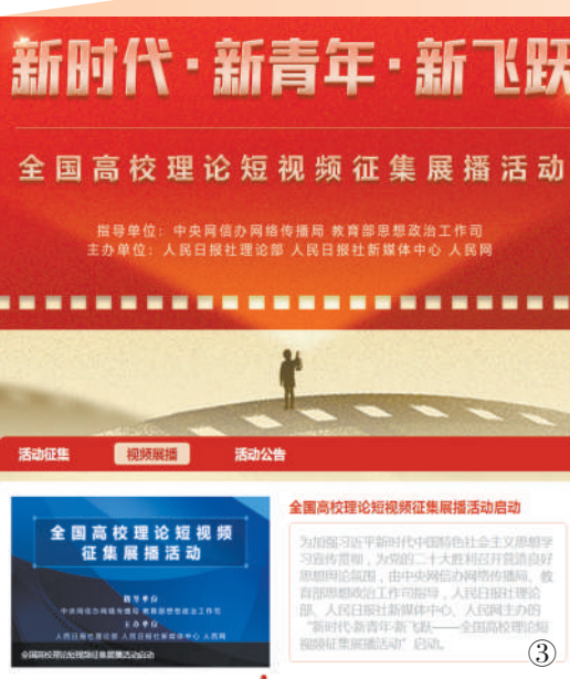
图③:为了让党的创新理论进校园、进课堂,人民日报社理论部、新媒体中心、人民网联合举办“新时代·新青年·新飞跃——全国高校理论短视频征集展播活动”。通过征集具有思想创意、理论传播、视觉表达等优势的理论短视频作品进行展播,让理论宣传在青年群体中更接地气、聚人气。

北京大学、清华大学、中国人民大学等全国200多所院校师生热情参与征集活动,目前已收到400多件作品。