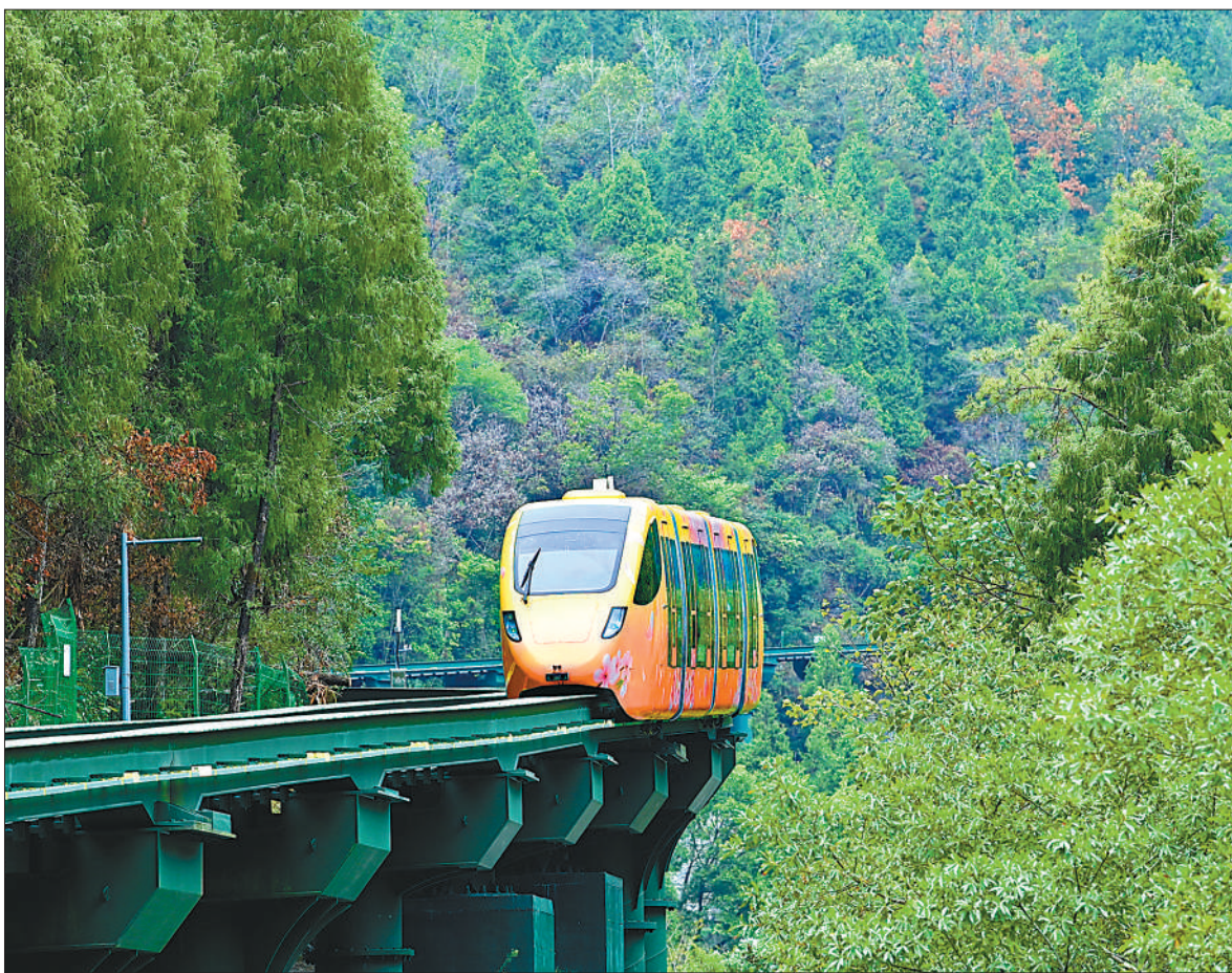
近年来,重庆市酉阳土家族苗族自治县推动旅游产业发展,带动群众增收致富。今年上半年全县接待游客549万人次,旅游综合收入实现同比增长。图为近日,一辆轨道观光车在该县桃花源国家森林公园内行驶。