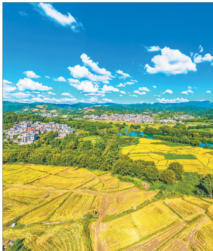
10月4日,广西梧州市蒙山县黄村镇,金色稻田使田野处处展现丰收美景。何华文摄(影像中国)

(综合本报记者史自强、周欢、李俊杰、苏滨、肖家鑫、王者、齐志明、刘新吾、罗艾桦、庞革平、宋豪新、尹晓宇、翟钦奇、巨云鹏、刘雨瑞报道)