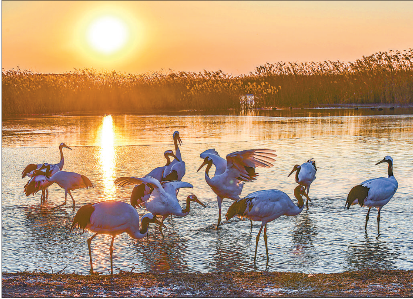
图①:丹顶鹤在辽宁省盘锦市辽河口国家级自然保护区嬉戏。