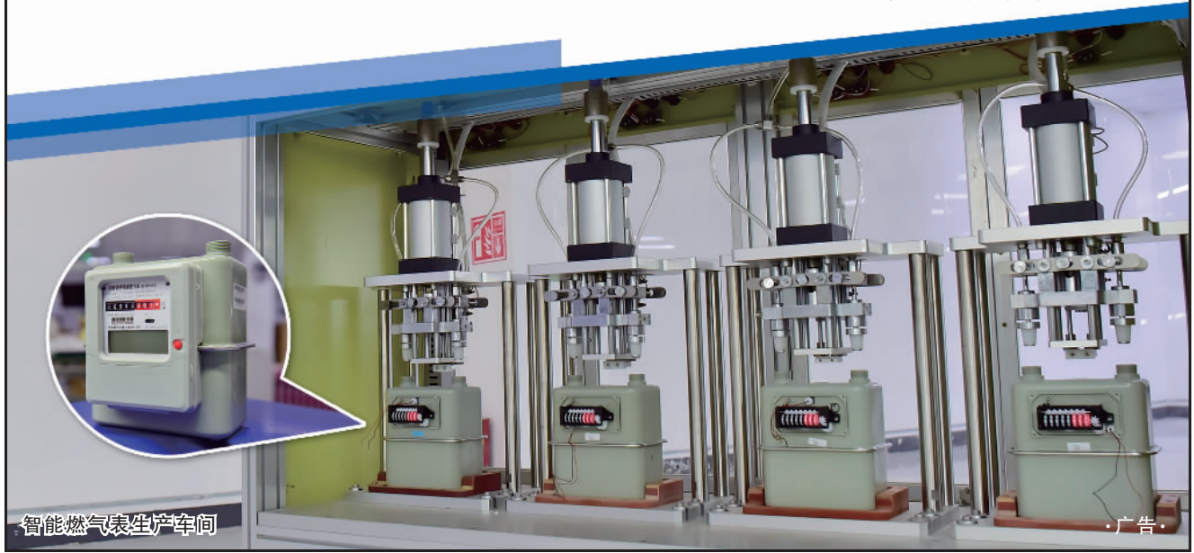
智能燃气表生产车间