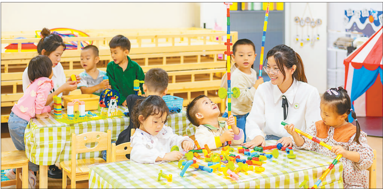
9月27日,在安徽省滁州市第一幼儿园琅琊新区分院,托班的孩子们在老师陪伴下拼搭积木。