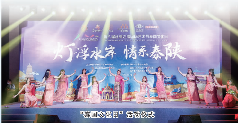
“泰国文化日”活动仪式