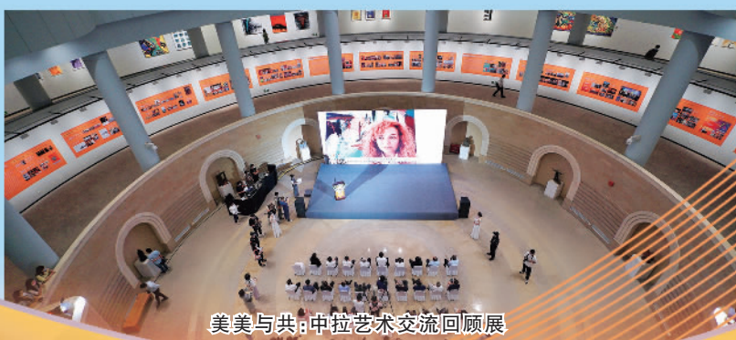
美美与共：中拉艺术交流回顾展