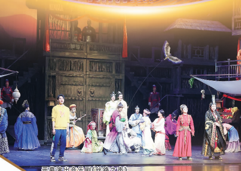
开演演出音乐剧《丝路之声》

2013年，“一带一路”倡议正式提出，古老的丝绸之路焕发生机。经党中央、国务院批准，作为国内首个以丝绸之路为主题的国际艺术节，丝绸之路国际艺术节自2014年开始举办并永久落户陕西，成为彰显丝路精神、展示中外文化交流的重要平台和陕西省践行“一带一路”倡议的重要抓手。