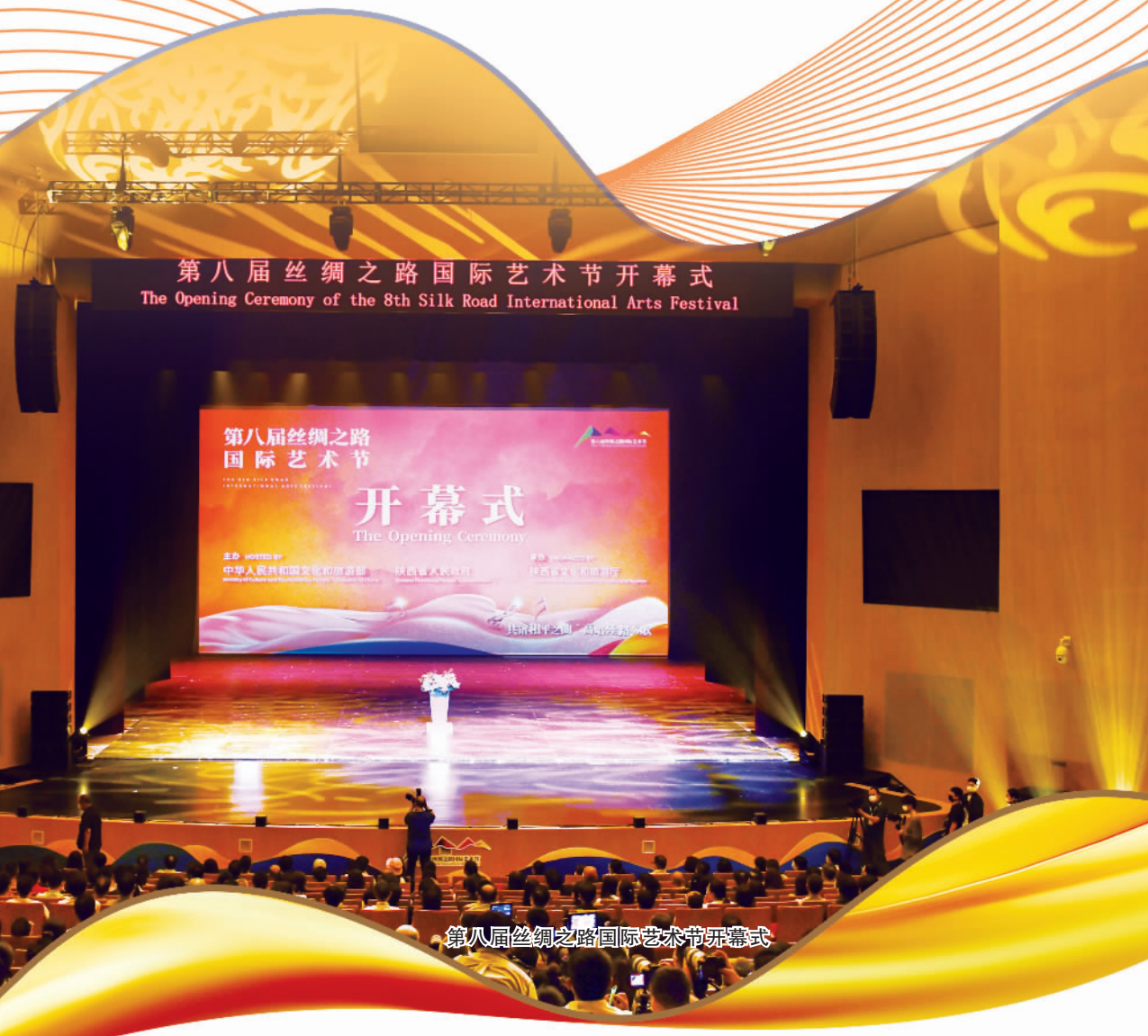
第八届丝绸之路国际艺术节开幕式