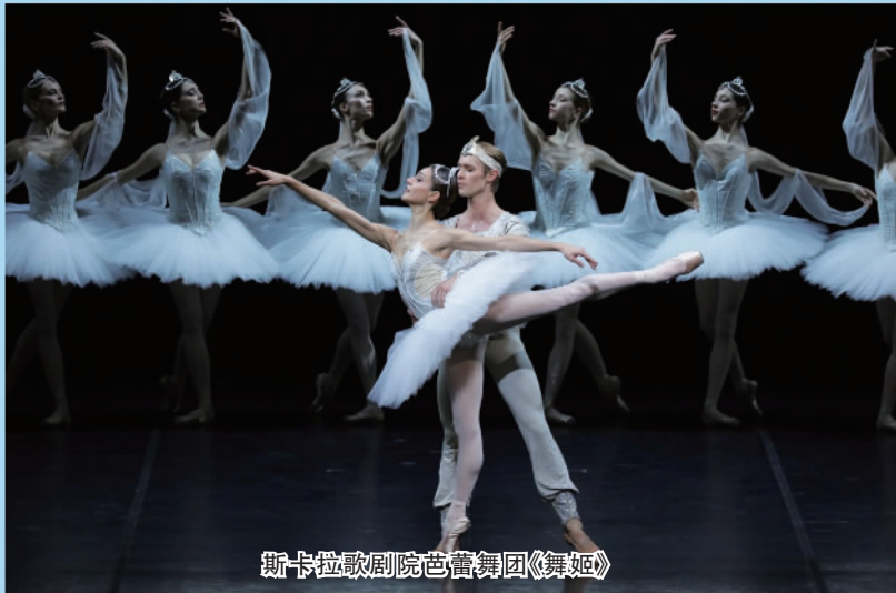
斯卡拉歌剧院芭蕾舞团《舞姬》