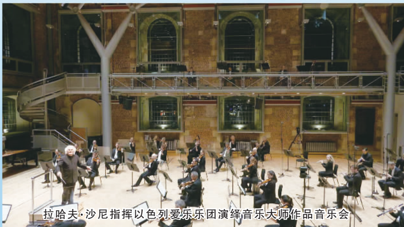
拉哈夫·沙尼指挥以色列爱乐乐团演绎音乐大师作品音乐会