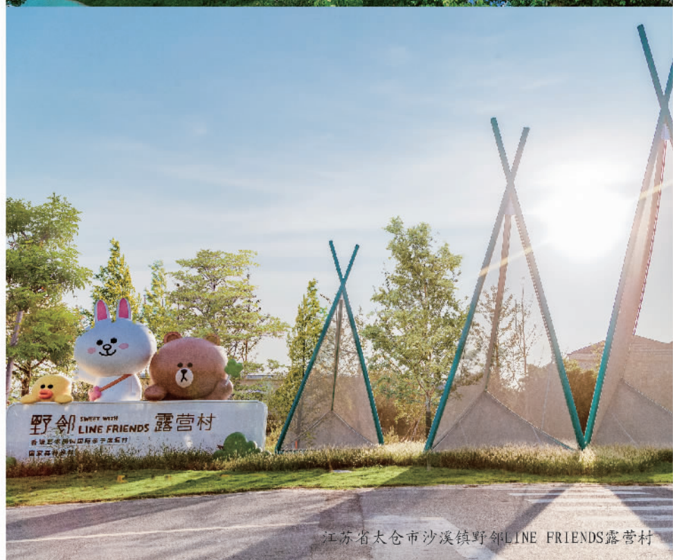
江苏省太仓市沙溪镇野邻LINE FRIENDS露营村