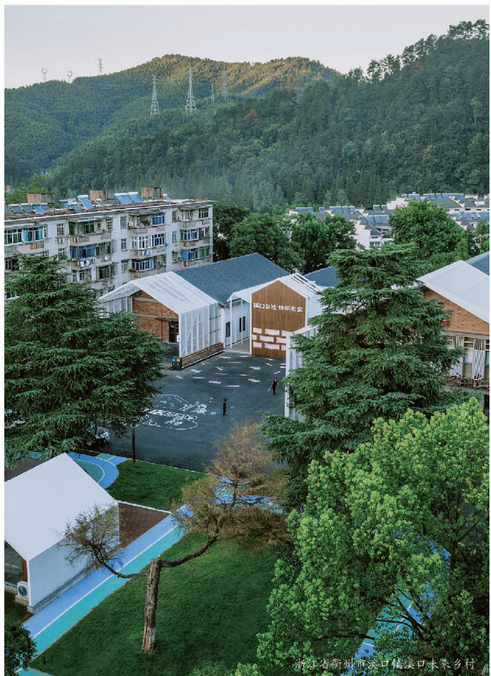
浙江省衢州市溪口镇溪口未来乡村