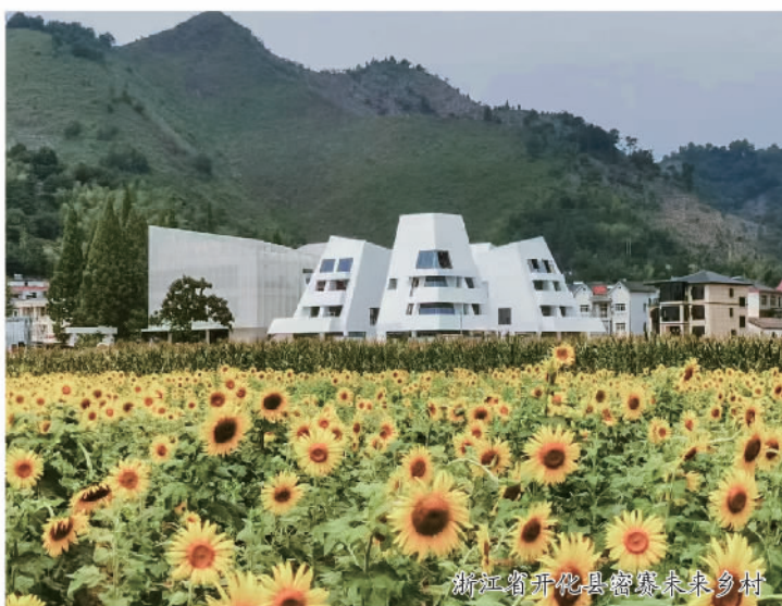
浙江省开化县富源未来乡村

多年探索实践，乡伴总结出一套切实可行的方法论。从村容村貌基础环境建设，到发掘当地特色、打造运营空间，再转入开发研学观光、产业创新、品牌IP营造等产品的全面运营，乡伴完