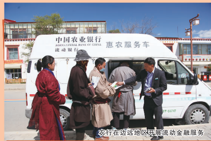
农行在边远地区开展流动金融服务