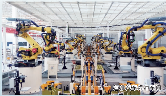
江淮汽车焊冲车间