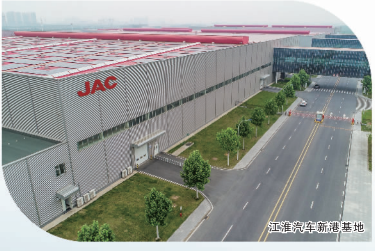
江淮汽车新港基地