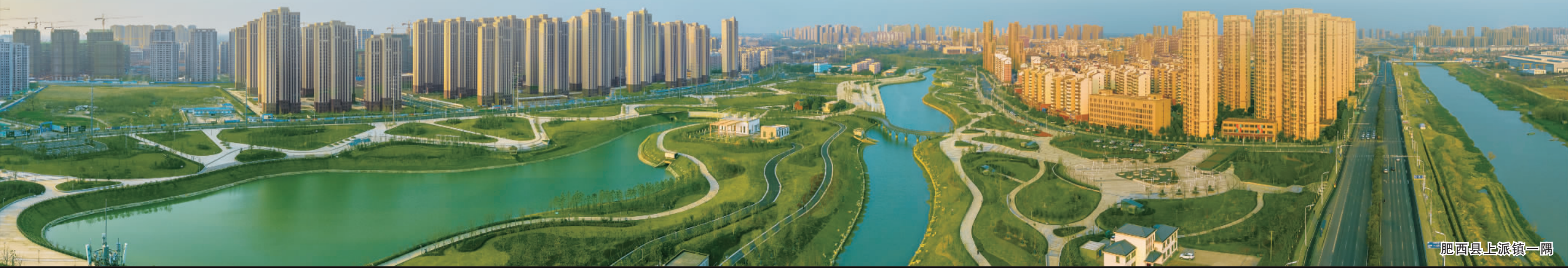
肥西县上派镇一隅