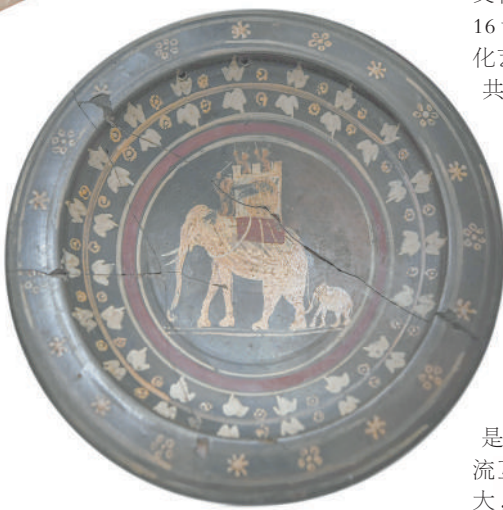
▲ 祭拜玛尔斯、维纳斯和森林之神西尔瓦诺斯的圣坛。 ▲ 战象献纳品盘。 ▲ 建城仪式浮雕。