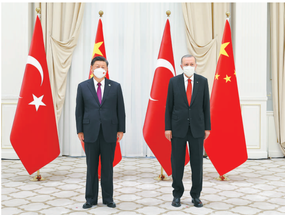
当地时间9月16日上午,国家主席习近平在撒马尔罕国宾馆会见土耳其总统埃尔多安。

本报乌兹别克斯坦撒马尔罕9月16日电 (记者张明辉、隋鑫) 当地时间16日上午,国家主席习近平在撒马尔罕国宾馆会见土耳其总统埃尔多安。