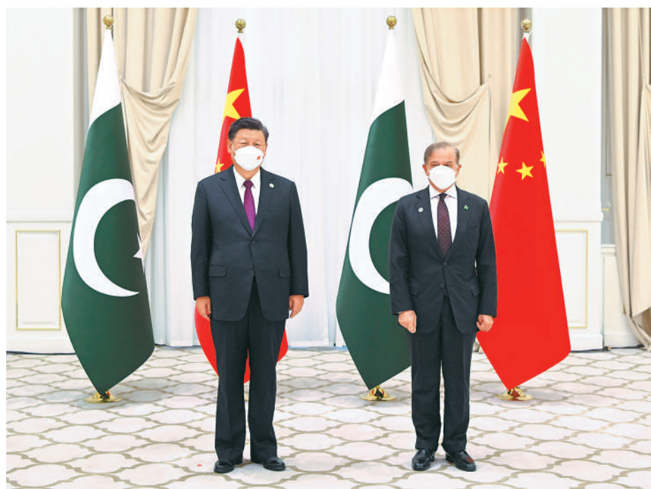
当地时间9月16日上午,国家主席习近平在撒马尔罕国宾馆会见巴基斯坦总理夏巴兹。

本报乌兹别克斯坦撒马尔罕9月16日电 (记者肖新新、张明辉) 当地时间16日上午,国家主席习近平在撒马尔罕国宾馆会见巴基斯坦总理夏巴兹。