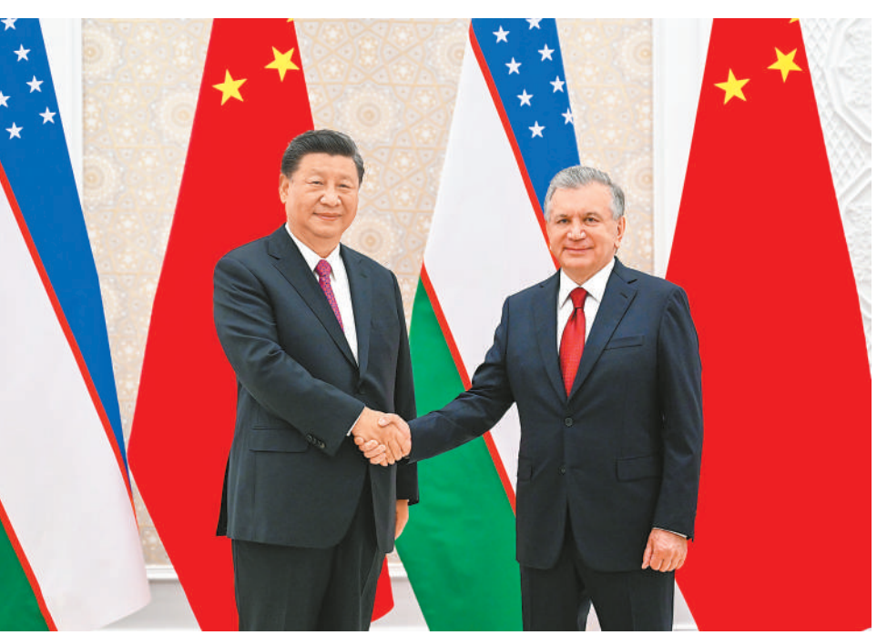
当地时间9月15日,国家主席习近平在撒马尔罕同乌兹别克斯坦总统米尔济约耶夫会谈。

习近平穿过兼具浓郁乌兹别克斯坦民族传统元素和现代时尚设计的中央大厅,前往北门外广场。