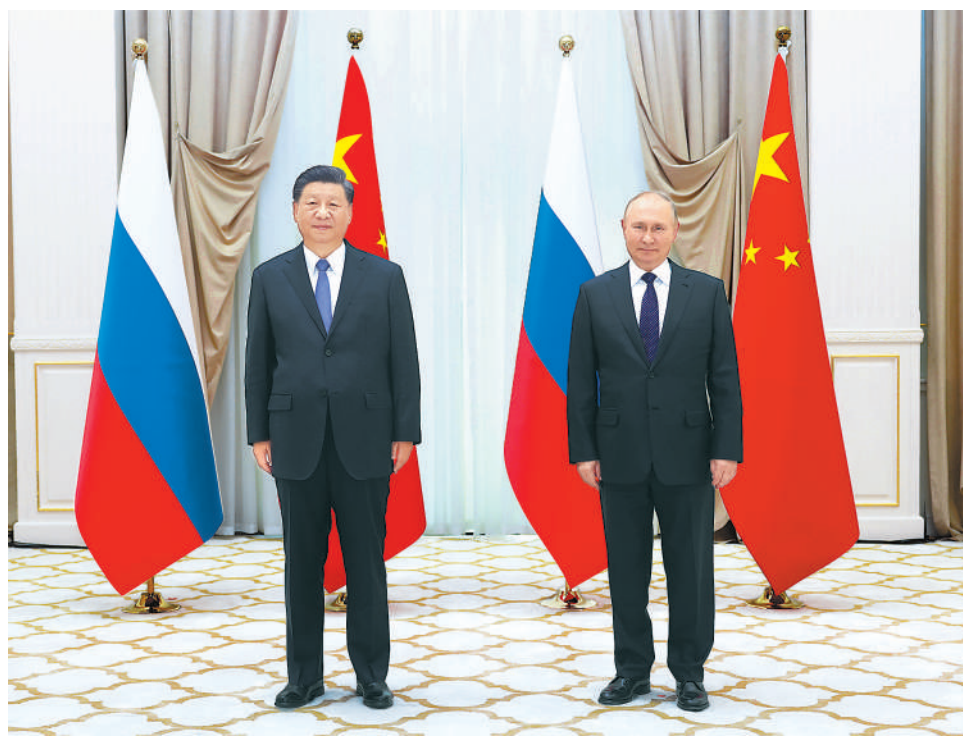
当地时间9月15日下午,国家主席习近平在撒马尔罕国宾馆同俄罗斯总统普京举行双边会见,就中俄关系和共同关心的国际和地区问题交换意见。

通。两国各领域合作稳步推进,体育交流年活动有序开展,地方合作和人文交流更加热络,在国际舞台上密切协调,维护国际关系基本准则。面对世界之变、时代之变、历史之变,中方愿同俄方一道努力,体现大国担当,发挥引领作用,为变乱交织的世界注入稳定性。