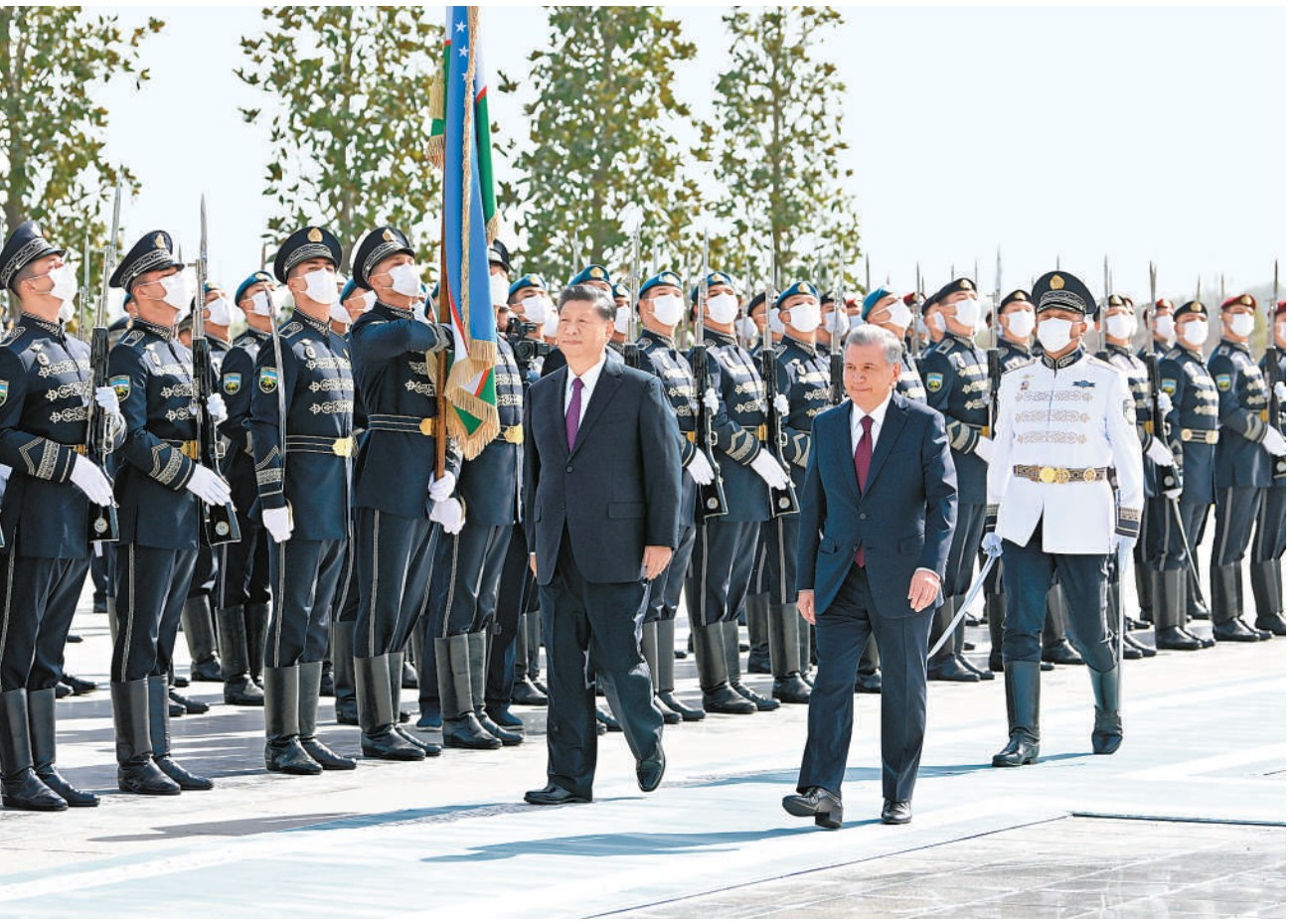
当地时间9月15日,国家主席习近平在撒马尔罕同乌兹别克斯坦总统米尔济约耶夫会谈。会谈前,米尔济约耶夫为习近平举行隆重欢迎仪式。