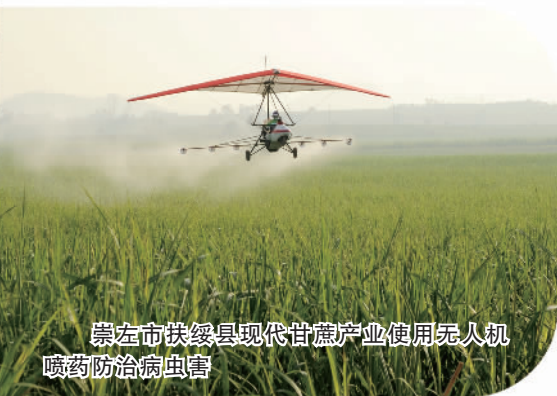
崇左市扶绥县现代甘蔗产业使用无人机喷药防治病虫害

“十四五”时期，广西将全力构建“10+3+N”现代特色农业产业体系，即做强粮油、糖蔗、蔬菜、水果、蚕桑、茶叶、中药材、畜牧业、渔业、生态林十大特色产业，做优现代种业、设施农业、数字农业三大农业支撑产业，做精N个“优中优”“特中特”“小而精”的亮点特色产业，全面实现乡村产业提档升级。