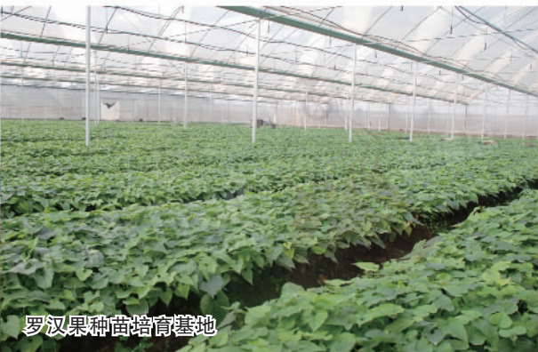
罗汉果种苗培育基地