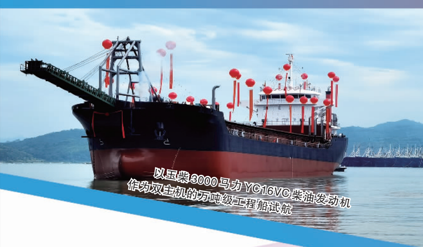
以玉柴3000马力的YC16VC柴油发动机作为双主机的万吨级工程船试航