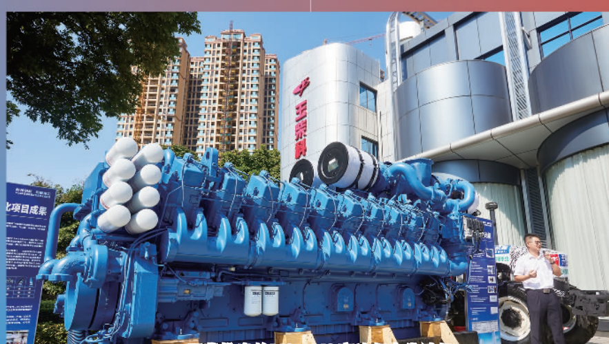
玉柴推出的YC20VC高速船电发动机