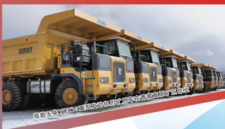
搭载玉柴YC6K16重型发动机的矿用卡车在青藏高原矿区作业