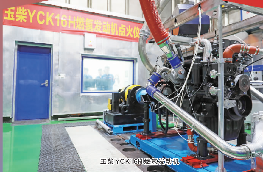
玉柴 YCK16H 燃氢发动机