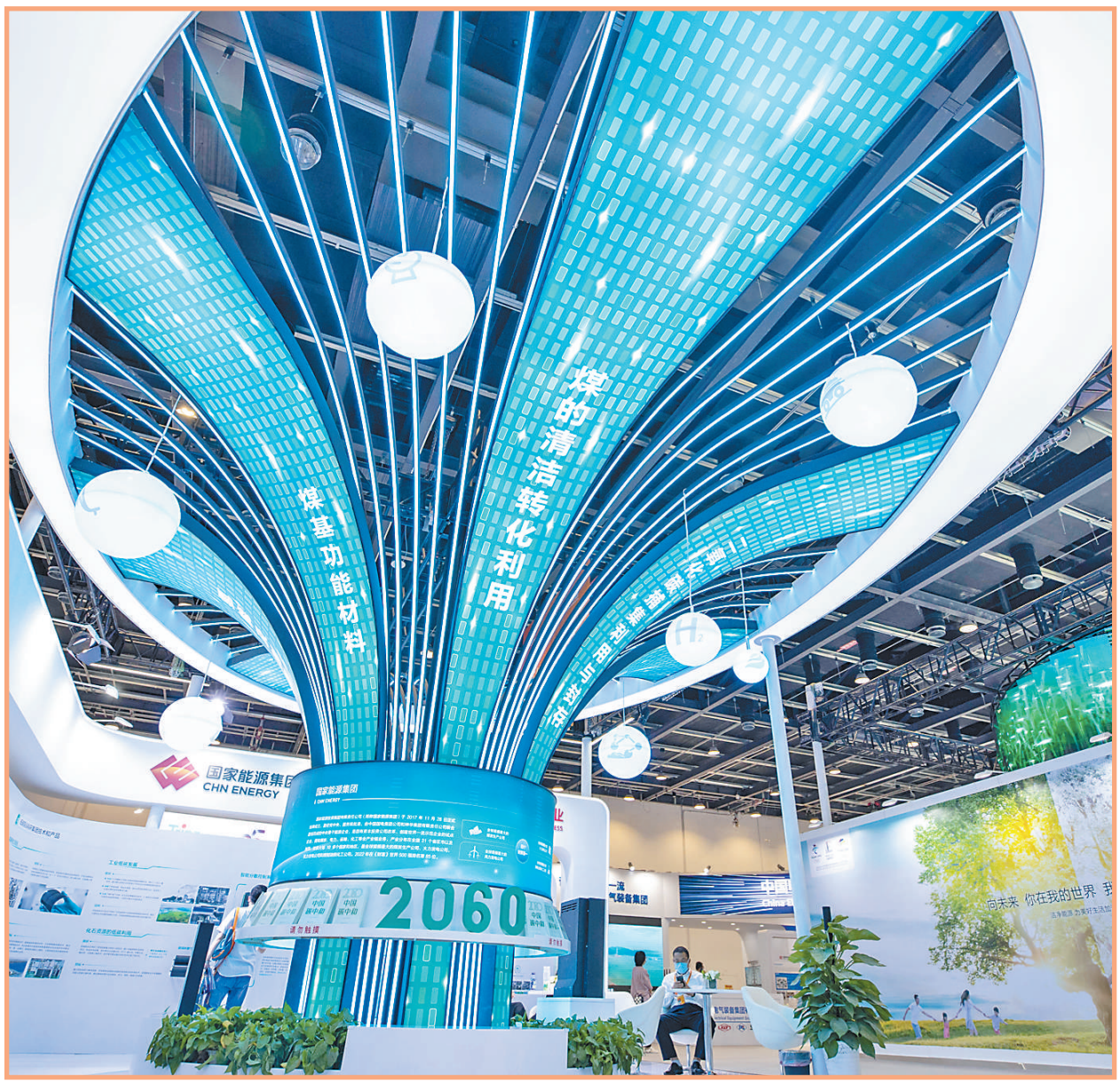
图①：来自北京建筑大学的志愿者在为参观者提供信息指引服务。 图②：服贸会上的国家能源集团展区。 图③：非遗传承人代表在向参观者介绍刺绣作品。 图④：参观者在体验东方时尚驾校的VR智能驾驶培训系统。 图⑤：小朋友在体验皮影戏表演。 图⑥：参观者正在选购商品。 图⑦：参观者在国家会议中心展区参观。