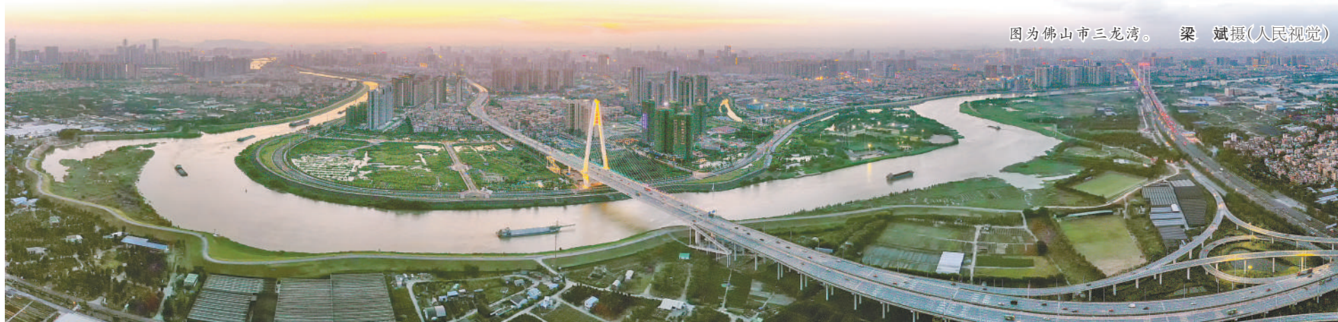
图为佛山市三龙湾。