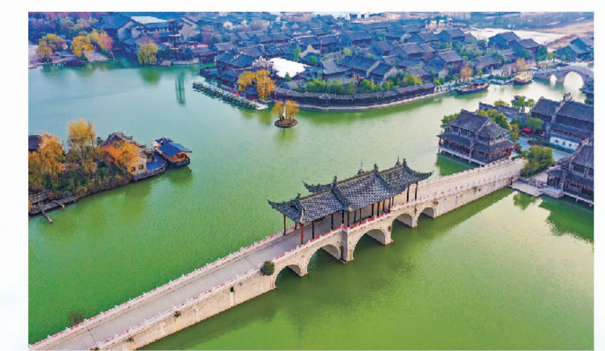
开封市朱仙镇启封故园