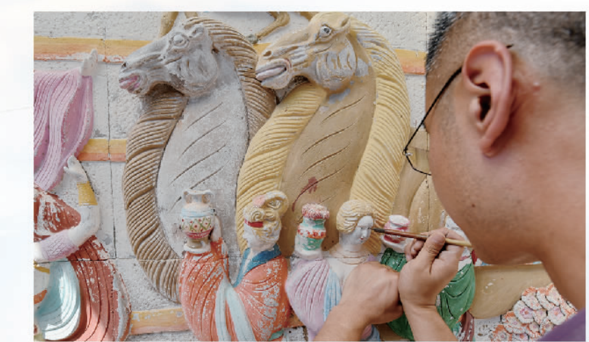
洛阳市孟津区朝阳镇南山唐三彩专业村，工艺美术师在创作大型仿古高浮雕彩绘壁画