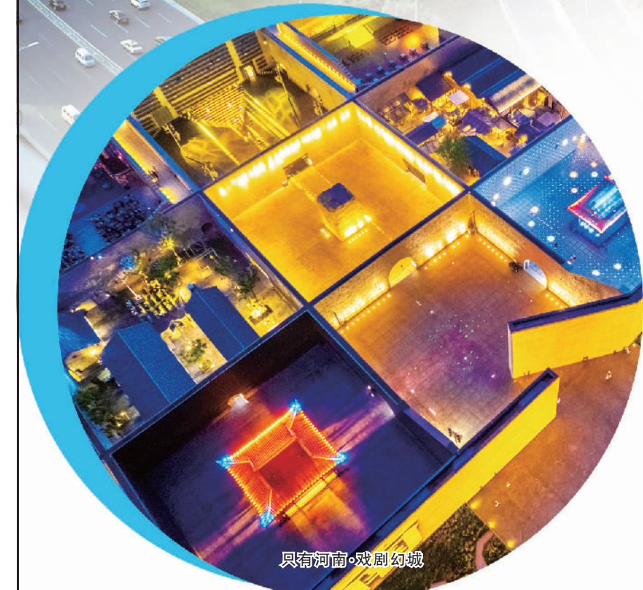
贝物河南·戏剧幻城