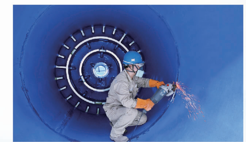
位于焦作市博爱县产业集聚区的河南龙佰智能装备制造有限公司，工人正在生产打磨化工设备