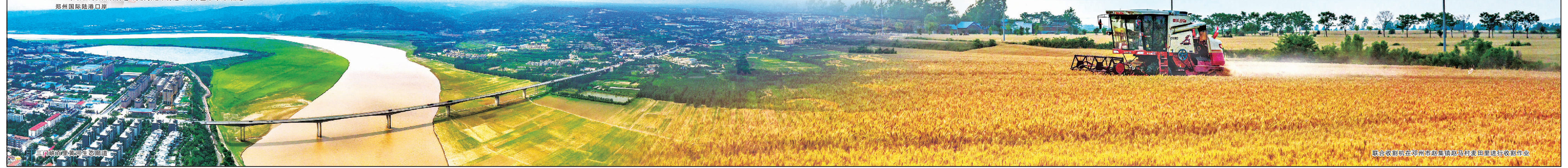
联合收割机在邓州市赵集镇赵村麦田里进行收割作业