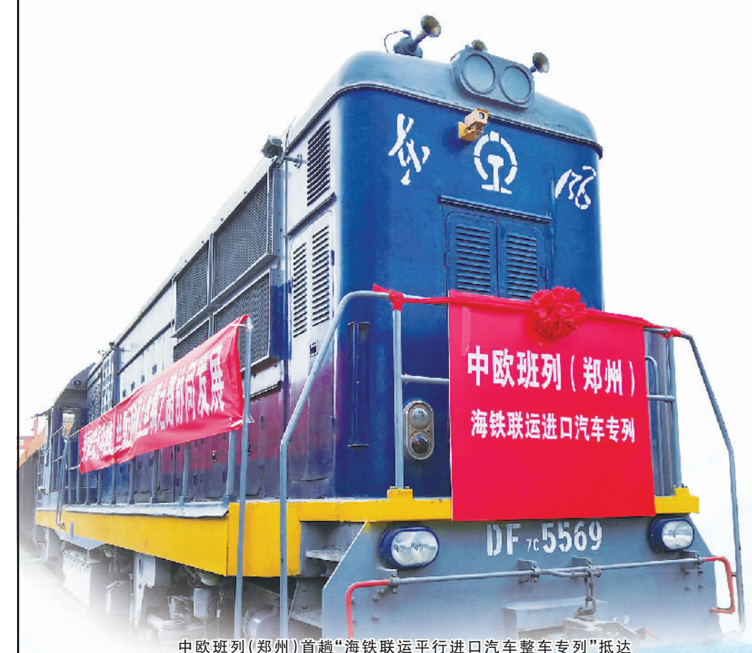
中欧班列(郑州)首趟“海铁联运进口汽车专列”抵达郑州国际陆港口岸