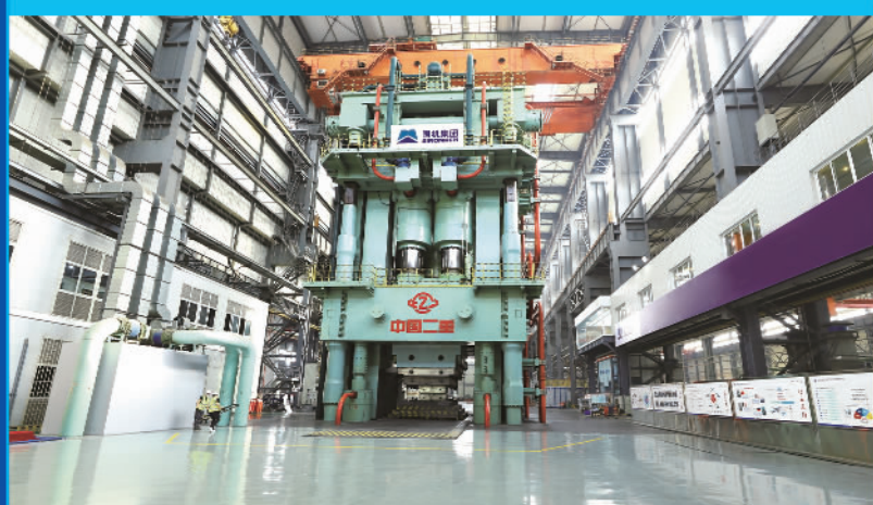
国机重型装备集团股份有限公司自主设计制造的8万吨模锻压力机