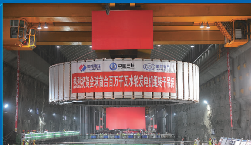
东方电机有限公司自主研发的全球首台百万千瓦水轮发电机组转子吊装