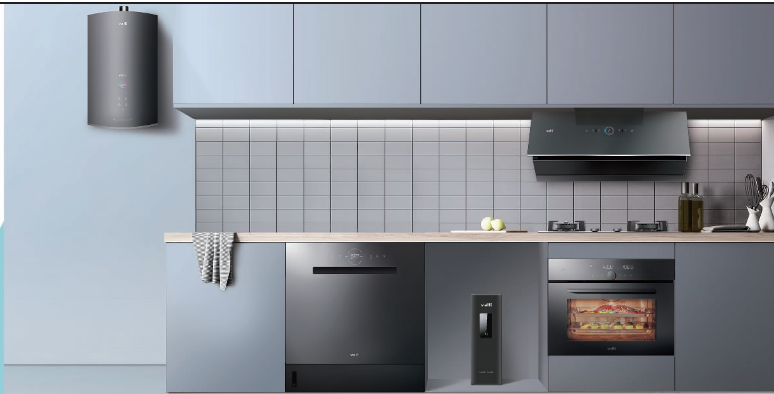
华帝推出全新宠爱套系厨电产品

厨房承载着人们对美好生活的向往。随着国民经济不断发展，人民生活质量不断提高，中国厨电行业日益发展进步。深耕厨电行业30年，华帝股份有限公司（简称“华帝”）坚持创新驱动、品质发展，紧跟时代、改革转型，努力开创厨电行业高质量发展新路径，赋能美好生活。