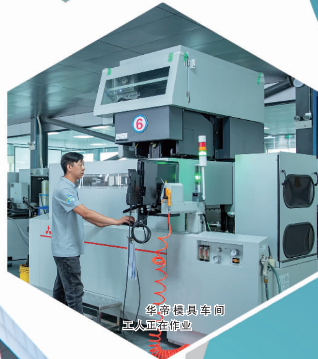
华帝模具车间工人正在作业