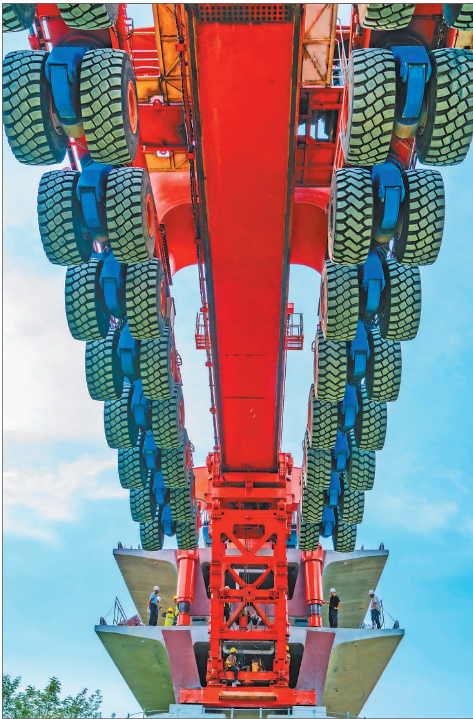
8月20日，安徽省池黄高铁(池州至黄山)青阳段青通河特大桥施工现场，工人将箱梁落放在指定桥墩之上。连日来，建设者们顶烈日、战高温，成功架设一榀榀箱梁，加快建设池黄高铁。

(上接第一版)靠的是一任接着一任干的坚守执着，靠的是全党全国各族人民的团结奋斗。”