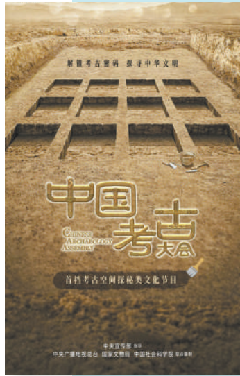
《中国考古大会》海报。

拓宽学术界与公众对话渠道，推动考古成果与历史研究成果的创造性转化和创新性发展，将进一步促进中华优秀传统文化的广泛传播，为社会注入源源不断的精神力量。