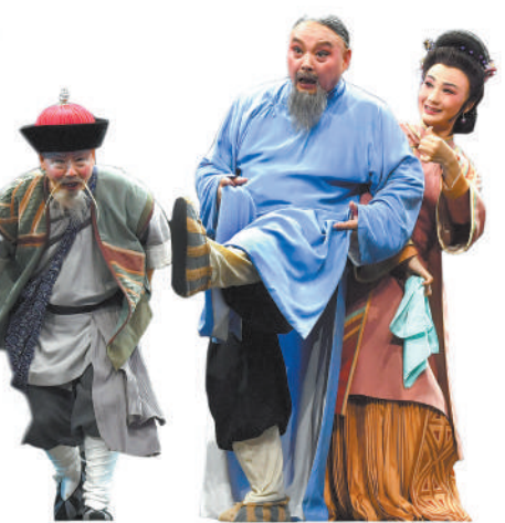
川剧《草鞋县令》剧照。

这些年，越来越多的考古工作者积极参与文化遗产的大众传播。在国家文物局和中国社会科学院等单位及考古界专家学者的参与下，越来越多的文化遗产类电视节目与观众见面。《国家宝藏》《典籍里的中国》《中国国宝大会》《中国考古大会》《古韵新声》《遇见文明》等一系列活化文化遗产的精品节目，让收藏在博物馆里的文物、陈列在广阔大地上的遗产、书写在典籍里的文字“活”了起来、“火”了起来。