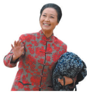
蒲剧电影《山村母亲》剧照。