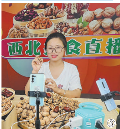
图③:陕西武功县,一名网络主播在销售特色农产品。