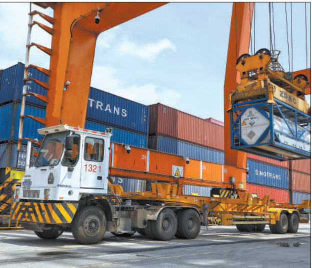
下图：江苏省连云港持续扩大陆海联运通道优势，一艘大型船舶正在装运集装箱。